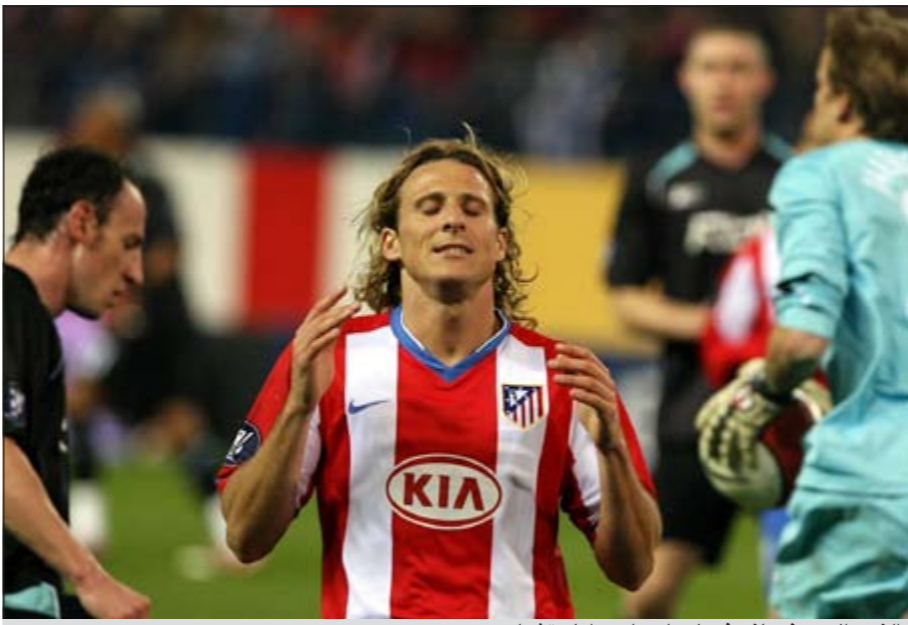
النجم الاوروغوياني فورلان لن يلعب امام تشيلي

يواجه التشيكي ايقان هاسيك مدرب الاهلي الاماراتي خطر الاقالة من منصبه بعد فشله في قيادة فريقه للفوز بلقب بطولة الاندية الخليجية السادسة والعشرين، وقد فشل الاهلي في تكرار فوزه ذهابا في الدور النهائي للبطولة الخليجية على مواطنه الشباب 2-3، اذ خسر اياها 0-2 الخميس الماضي ليفقد فرصة احراز اللقب للمرة الاولى في تاريخه.