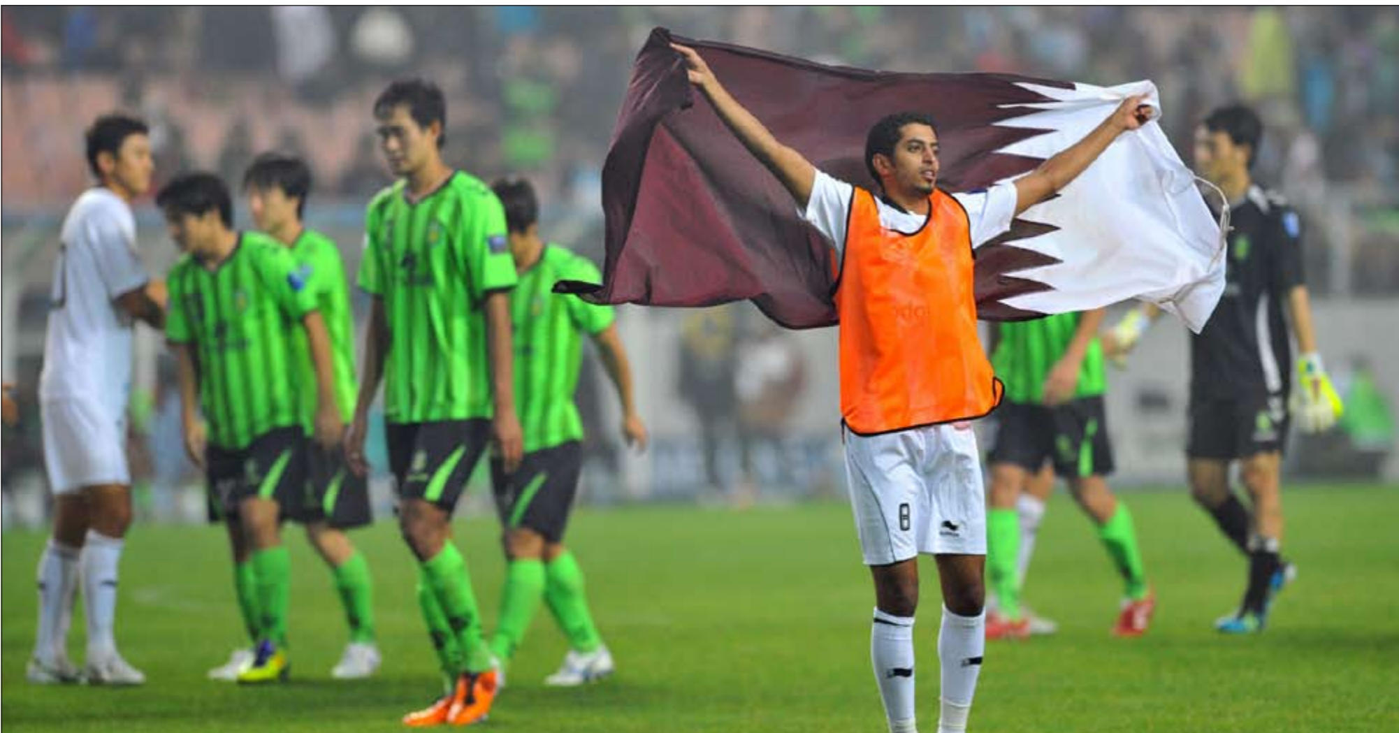
فرحة لاعبي السد في معقل الفريق الكوري الجنوبي شونوبوك

في الكويت كتبت «الراي»: «فاز على شونوبوك ببركات الترجيح في نهائي دوري الابطال وتاهل الى موندبال الاندية»، اما «عالي آسيويا»، اما «الانباء» فعنونت بدورها «السد صقر آسيا للمرة الاولى».