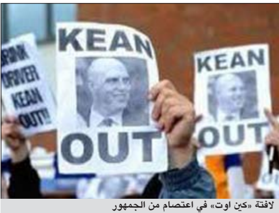
لافتة «كين اوت» في اعتصام من الجمهور

قدم الدوري الانجليزي طريقة جديدة لاعتراض الجماهير على المديرين او لحث مدرب فريقها على التخلي او لاجبار ادارة ناديهما لطرده.