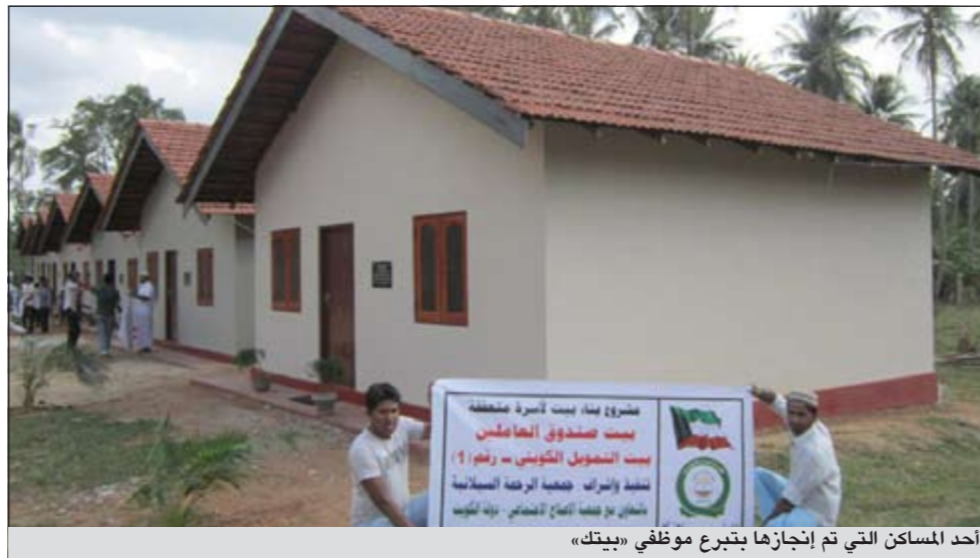
أحد المساكن التي تم إنجازها بتبرع موظفي «بيتك»

أعلن صندوق العاملين في بيت التمويل الكويتي (بيتك) عن الانتهاء من إنجاز بناء مجموعة من المساكن للفقراء في شمال غرب سريلانكا ضمن أنشطة محفظة الخير التي تستهدف إقامة مشاريع حيوية لصالح الفقراء والأيتام في الدول المحتاجة، حيث بدأت نشاطها في 2006. وكان صندوق العاملين في «بيتك» قد أتاح المجال لجميع الموظفين للتبرع خلال شهر رمضان المبارك - كما جرت عليه العادة - من أجل إقامة المشروع الذي لقي ترحيبا شديدا من المتبرعين حيث يتم توفير المسكن المناسب الذي يؤوي العديد من الأسر المحتاجة وهو ما يؤكد وجود الرغبة لدى موظفي «بيتك» في القيام بالدور الاجتماعي والإنساني معا.