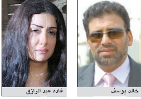
غادة عبد الرزاق