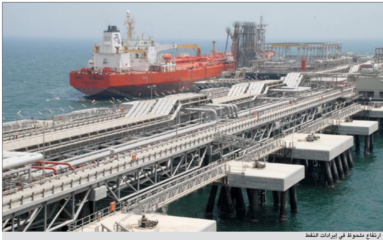
ارتفاع ملحوظ في إيرادات النفط

المقدرة في الموازنة. ومع إضافة نحو 1,1 مليار دينار إيرادات غير نفطية، ستبلغ جملة إيرادات الموازنة للسنة المالية الحالية نحو 27,7 مليار دينار وبمقارنة هذا الرقم باعتمادات المصروفات، البالغة نحو 19,435 مليار دينار سنكون النتيجة تحقيق فائض النفطية المحتملة للسنة المالية الحالية بمجموعها نحو 26,6 مليار دينار، وهي قيمة أعلى بنحو 14,3 مليار دينار عن تلك