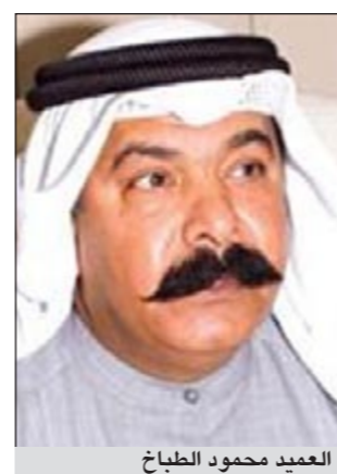
العميد محمود الطباخ

تمكن رجال الإدارة العامة للمباحث الجنائية بقيادة العميد محمود الطباخ من توقيف شاب من غير محدد الجنسية وإيراني كشفت التحقيقات معهما عن اعتيادهما ابتزاز عشاق الخليج من الوافدين وتهديدهم للوافدين باحالتهم الى المباحث بتهمة الفعل الفاضح، او ان يدفعوا لهما مقابل عدم احالتهم وتجنب الفضيحة.