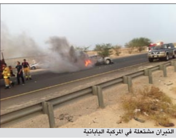
النيران مشتعلة في المركبة اليابانية

وتهديد بإلحاق الأذى» انها كانت على علاقة صداقة بوافدة اردنية ونظراً لزوجها من مواطن كان من الطبيعي ان تتعد عن صديقتها الأردنية للحفاظ على اسرتها وحتى لا تدخل منزلها في اي وقت ويكون زوجها عرضة للتحريض.