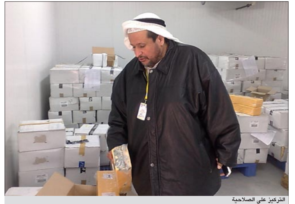
التركيز على الصلاحية