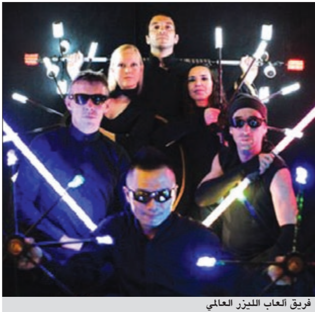
فريق ألعاب الليزر العالمي