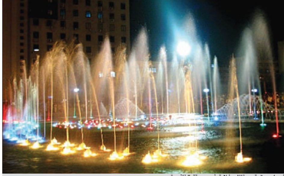
أجواء ممتعة ومناظر خلابة في حديقة النافورة