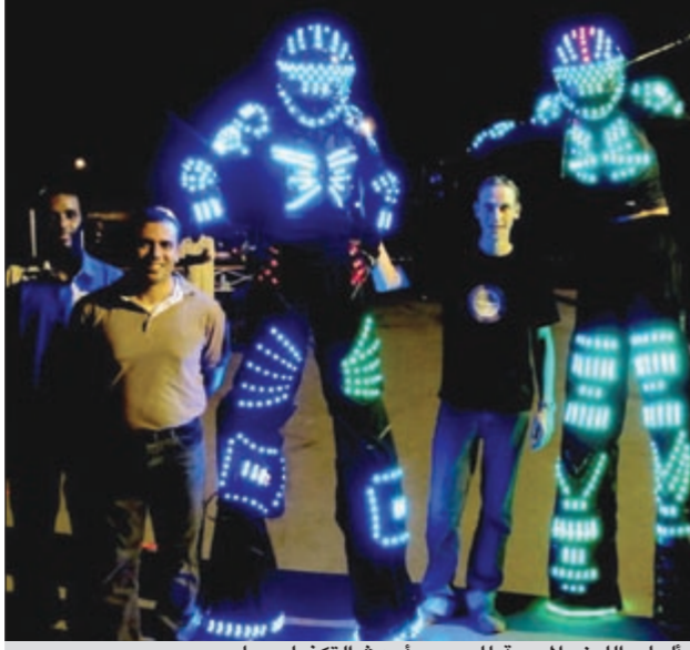
ألعاب الليزر المحببة للجميع بأحدث التكنولوجيا