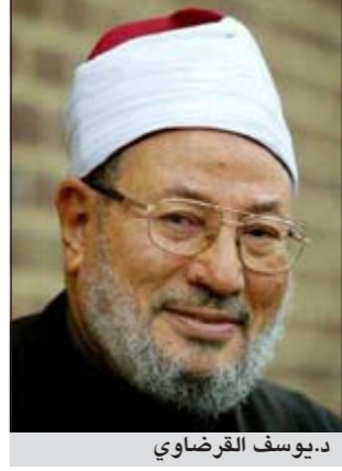
د. يوسف القرضاوي

الرياض - العربية: رأى أكاديمي سعودي أن مطالبة الشيخ د. يوسف القرضاوي للعاهل السعودي السماح للنساء بقيادة السيارة هو من باب «الفتاوى المستوردة»، قائلاً أن علماء الحرمين «الموثوق» بدينهم، اتفقت كلمتهم على «تحريم قيادة النساء»، موجهاً القول إلى د. القرضاوي بأن عليه الاهتمام بقضايا الأمة الكبرى.