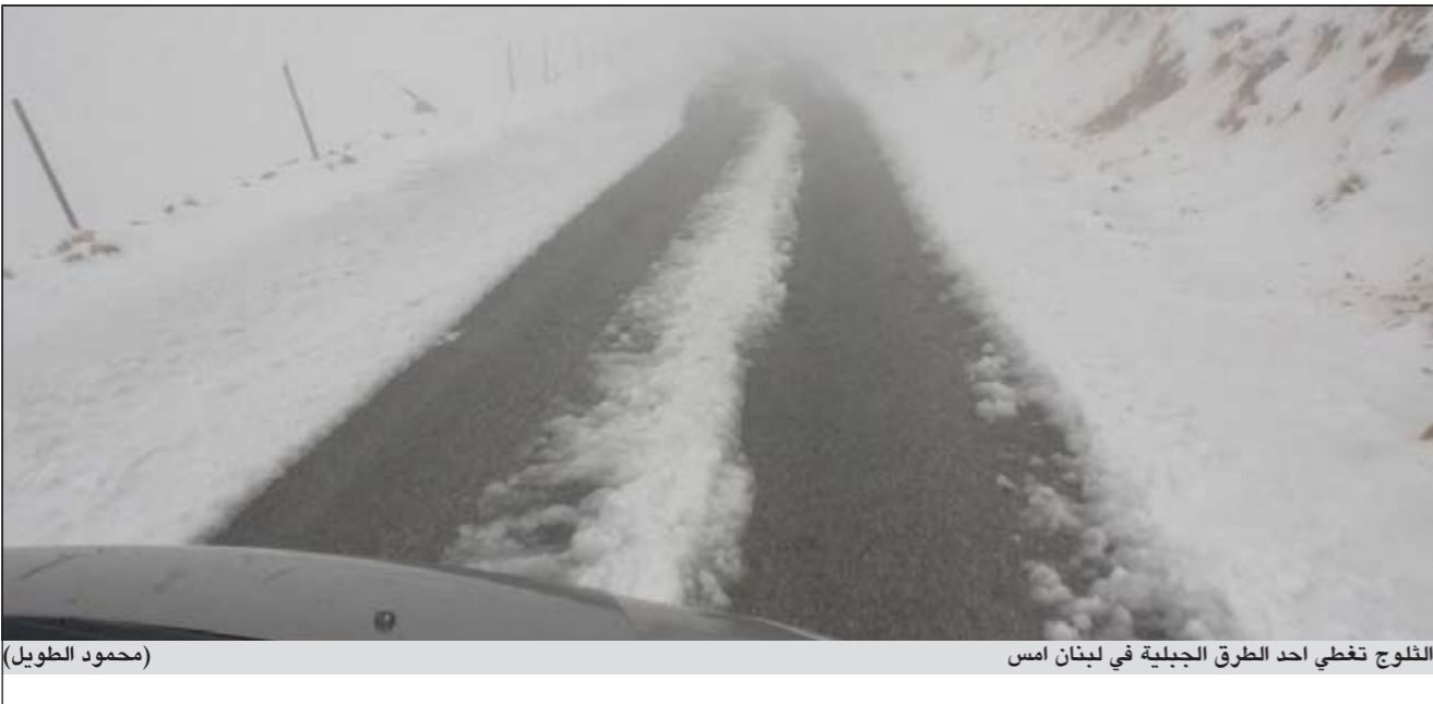
الثلوج تغطي احد الطرق الجبلية في لبنان امس

غطت الثلوج جبال لبنان عشية عيد الأضحى المبارك، حيث تساقطت على ارتفاع 1700 متر وقطعت طرقات عديدة أعيد فتحها على الفور. وتعد هذه أول عاصفة ثلجية تضرب لبنان في وقت مبكر من هذا العام إذ توقع خبراء ارساد أن يكون هذا العام شديد البرودة تتخلله العديد من العواصف الثلجية.