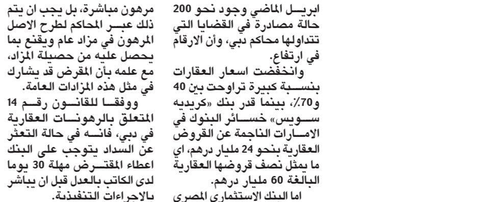
البنوك الإماراتية تسعى لملاحقة الحاصلين على قروض عقارية

وفيما يتعلق بالاداء المتركم للبورصات الخليجية منذ بداية العام الحالي 2011 حتى نهاية أكتوبر الماضي، فقد انخفضت جميع البورصات الخليجية تقديرات بخسارتها 24 مليار درهم البنوك الإماراتية تلجأ للمحاكم بعد نفاذ صبرها تجاه المتعثرين في سداد القروض العقارية