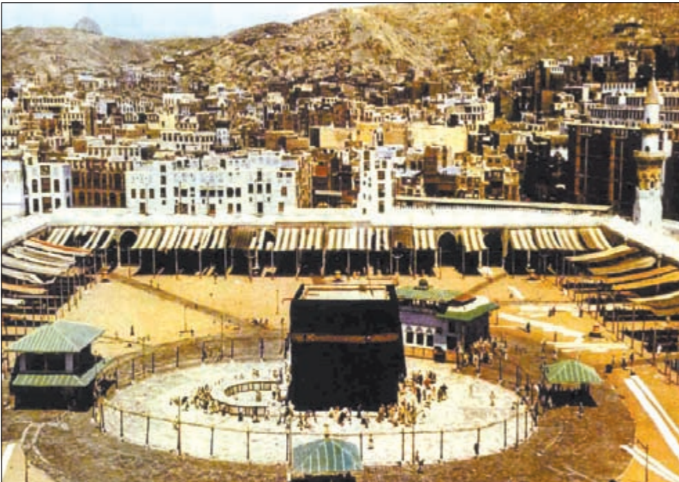
أول صورة ملونة للحرم الشريف والكعبة عام 1953

أما التعديل الأهم حسب مدير مركز البحوث فهو تصحيح التصحيحات التي وقع فيها كاتب الرحلة في أسماء الأماكن، ويبدو ان التصحيح ناشئ عن عدم سماع الاسم على الوجه الصحيح في أثناء الطوق.