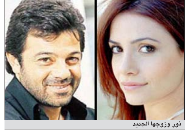
نور وزوجها الجديد

وذكرت صحيفة «ميليت» التركية السبت 30 أكتوبر