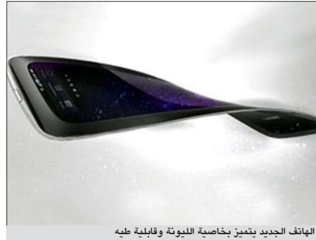
الهاتف الجديد يتميز بخاصية الليونة وقابلية طيه

ورجحت أن تطرحه في الأسواق أوائل العام المقبل. وقال المتحدث باسم «سامسونغ»: أن الإصدار الأول لهذه التكنولوجيا سيطبق على الهواتف المحمولة، ويمكن تطبيقه لاحقاً على أجهزة الكترونية أخرى مثل «آي باد»، وفق ما ذكرت صحيفة «ديلي مايل».