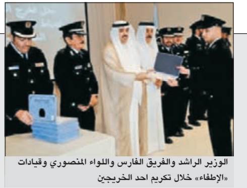
الوزير الراشد والفريق الفارس واللواء المنصوري وقيادات «الإطفاء» خلال تكريم أحد الخريجين

المغردون اعتصموا أمام قصر العدل والنيابة تخلي سبيل العليان بكفالة والتحقيقات مع المطيري بعد العيد