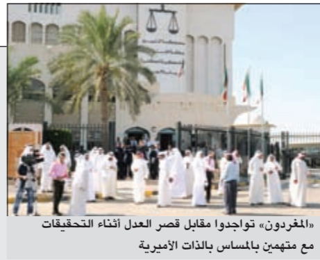
«المغردون» تواجدوا مقابل قصر العدل أثناء التحقيقات مع متهمين بالتمسك بالذات الأميرية