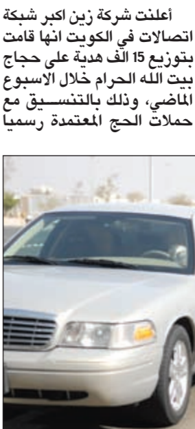
جانب من توزيع الهدايا

اعلنت شركة زين اكبر شبكة اتصالات في الكويت انها قامت بتوزيع 15 الف هدية على حجاج بيت الله الحرام خلال الاسبوع الماضي، وذلك بالتنسيق مع حملات الحج المعتمدة رسميا من قبل وزارة الاوقاف. وذكرت الشركة في بيان صحافي انها قامت بهذه المبادرة من منطلق حرصها على مشاركة الحجاج المشاعر الالهية التي تسبب على هذه اللحظات، مبيئة انها حريصة ايضا على ان تكون على مقربة باستمرار من زوار بيت الله الحرام كل عام. وأشارت زين الى انها قامت ايضا بتوزيع الهدايا على الحجاج المغادرين عن طريق البر اثناء تواجد موظفيها في منفذ السالمي، مبيئة انها وجدت تعاونا كبيرا مع وزارة الداخلية خلال هذه المبادرة.