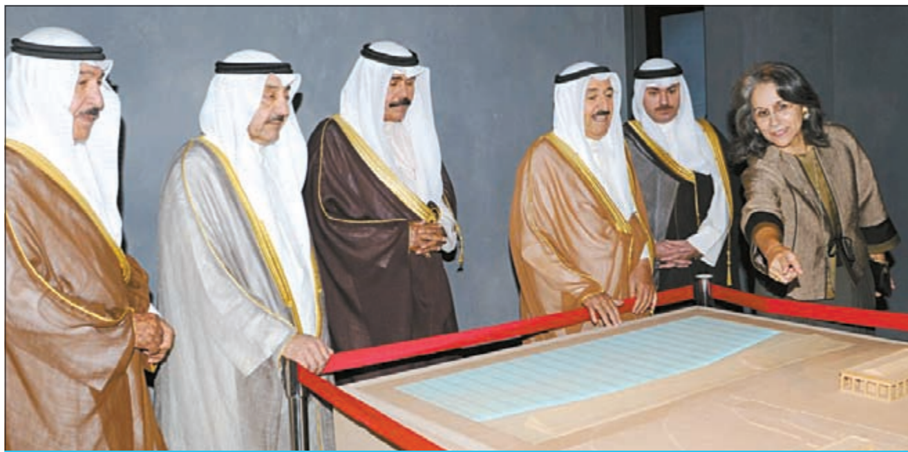
صاحب السمو الأمير الشيخ صباح الأحمد يستمع لشرح من الشيخة حصة الصباح حول معرض ذخيرة الدنيا بحضور سمو ولي العهد الشيخ نواف الأحمد ورئيس مجلس الأمة جاسم الخرافي والشيخ جابر العبدالله والشيخ خالد العبدالله

دخلت منطقة جليب الشيوخ حيز الاهتمام الحكومي بحزمة هامة من القرارات التي ستضع حداً لمعاناة أهالي المنطقة وستحول الجليب من هاجس أمني وبؤرة خلل اجتماعي إلى منطقة استثمارية من طراز رفيع. وقال رئيس مجموعة المصادر الوطنية ناصر البرغش إن المجموعة حركت الماء الراكد بإطلاقها مبادرة المثلث الذهبي لتطوير منطقة جليب الشيوخ بدراسة متكاملة وضعت تصوراً لحل مشاكل المنطقة عن طريق تحويلها لمنطقة غير سكنية أو بالأحرى منطقة خدمات مساندة للمناطق المحيطة بها، وذلك تم تقسيمها لـ 6 قطاعات مختلفة يختص كل قطاع منها بمجموعة من الخدمات المتخصصة. تنفس أهالي منطقة جليب الشيوخ الصعداء بعد حزمة قرارات حكومية منها إقرار تفتين منطقتهم جليب الشيوخ وإعادة تأهيلها والتي اعتبروها أحد أبرز القرارات الحكومية بشأن تطوير المنطقة ووضع حد لسنوات طويلة من المعاناة، وبناء على توجيهات مجلس الوزراء اصدر وزير الأشغال العامة ووزير الدولة لشؤون البلدية د.فاضل صفر القرار 549 لسنة 2011 بتشكيل لجنة لبحث مشاكل وحلول منطقة جليب الشيوخ. • التفاصيل ص 16