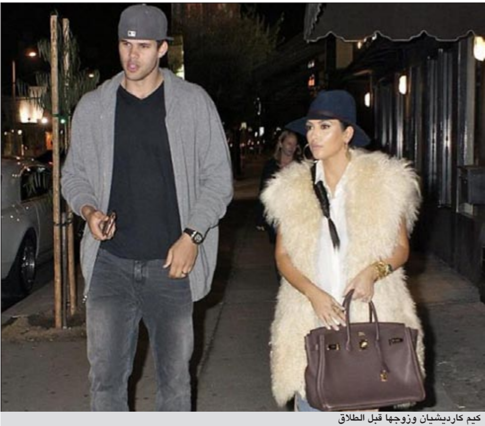
كيم كارديشيان وزوجها قبل الطلاق

منذ البداية»، وأضاف «كيم كانت تبحث عن زوج واختارت كريس وهي لم تكن تحبه ولكنها أملت أن يحدث ذلك بعد الزواج». ووفقاً لتقارير إخبارية فإنه سيتم تقسيم أصول الزوجين وفقاً لاتفاقية ما قبل الزواج. وستتمكن كيم من الاحتفاظ بما كسبته أثناء فترة زواجها القصيرة. وأصدرت شبكة اي التلفزيونية التي تبث برنامج كاردشيان بياناً لها حول الطلاق جاء فيه «جميع طاقم العمل بالشبكة يشعر بالصدمة إزاء هذه الأنباء ونحن نحرب عن دعمنا لكيم وكريس في هذا الوقت الصعب».