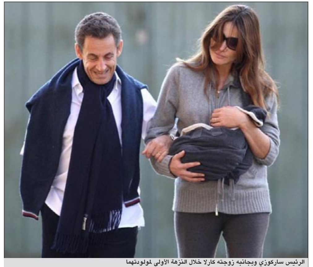
الرئيس ساركوزي وبجانبه زوجته كارلا خلال النزهة الأولى لمولودتهما

خرجت جوليا ساركوزي طفلة الرئيس الفرنسي الأولى من زوجته كارلا في نزهة مع والديها صباح أمس، بحديقة فرسا بمقر الرئاسة، وهو أول ظهور للطفلة مع والديها بعد ولادتها، كما ذكرت صحيفة التليغراف البريطانية. وأقادت الصحفية بان كارلا ساركوزي تاكدت