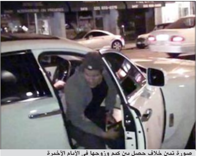
صورة تيمين خلاف حصل بين كيم وزوجها في الأيام الأخيرة

والقي ممثل كريس بياناً بالنيابة عنه جاء فيه «إنني ملتزم تجاه هذا الزواج وكل ما يمله». وأضاف «إنني أحب زوجتي وحننت عندما علمت أنها تقدمت بطلب للطلاق.. وإنني على استعداد لنبلل أقصى جهود لإنجاح الزواج». وكتب الإعلامي راين سكيريست الذي ينتج برنامج كاردشيان على صفحته في موقع تويتتر للتواصل الاجتماعي «نعم كيم