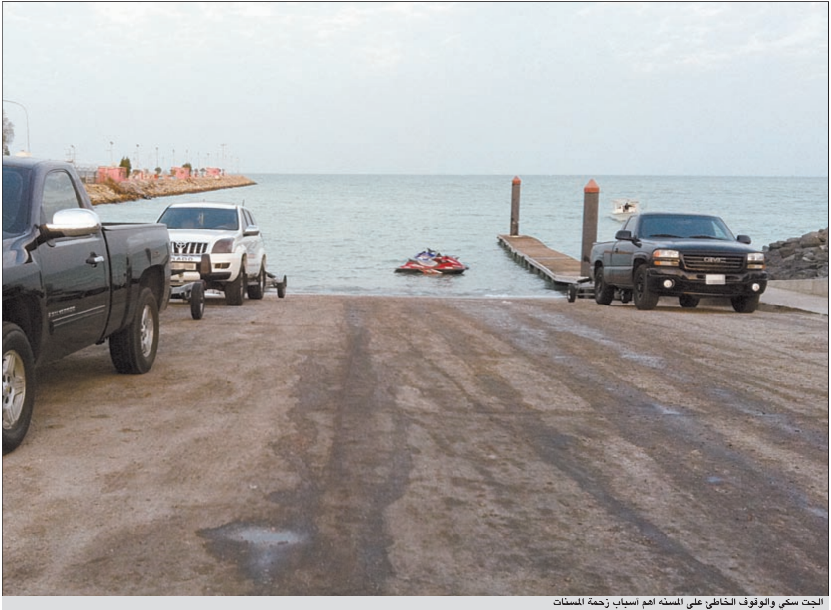
الجت سكي والوقوف الخاطي على المسنة اهم اسباب زحمة المسنات

● اسبوعياً نسلط الضوء على هذه الهواية، ونستقبل مشاركاتكم وصوركم وآراءكم. للتواصل معنا عبر هذه الصفحة أرسلوا تعليقاتكم على الايميل: bahri@alanba.com.kw. اعداد: هادي العنزي