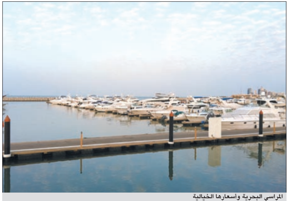
المراسي البحرية وأسعارها الخيالية