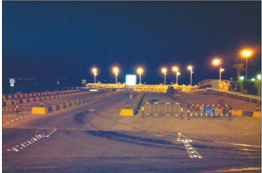
تعديلات ممتازة أجريت على مسنة الوطية

نهاية لا مصافق ولا بقالة ولا ثلج ولا ييم ولا حتى ماء سبيل بالعربي كانت قاعد بصحراء تدفع دينارين للمسنة واحسب حسابك بالخروج من البحر تجد المخالفة المرورية على سيارتك وخصوصاً بنهاية الأسبوع وازداد قبل عامين لي صديق من دولة خليجية زارني في الكويت وهذا الصديق طلب مني رحلة بحرية قصيرة وعندما شاهد هذه المسنة قال هذه المسنة صحيح يوجد منها في بلدي ولكن بسنة السبعين؟