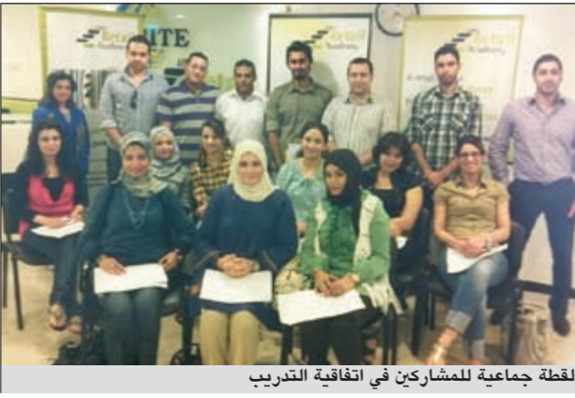
لقطة جماعية للمشاركين في اتفاقية التدريب