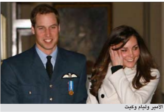
الأمير وليام وكيت

كما تلقت قصر سانت جيمس مئات الخطابات من الجمعيات الخيرية لطلب الدعم من الزوجين المكثبين الحريصين على استغلال نفوذهما في سبيل الخير. وخصص الزوجان صندوقاً لتلقي أموال كهدايا للزواج بلغت عائداته مليون جنيه أسترليني خصصت لصالح 26 مؤسسة خيرية.