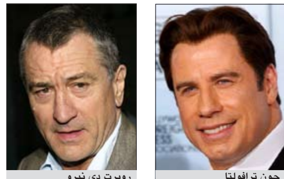
روبرت دي نيرو