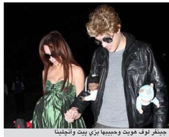
جينفر لوف هويت وحبيبها بزي بيت وأنجلينا جولي

يبدو أن الممثلة جينفر لوف هويت قطعت أي أمل لتصبح صديقة لعائلة براد وجولي حيث اختارت أن تتنكر هذا العام هي وحبيبها في حفل كيت هادسن بمناسبة هالوين كبراد بيت وأنجلينا جولي، فارتدت هويت فستان جولي الأخضر الذي ظهرت فيه وهي حامل في حفل جوائز الأوسكار فوضعت هويت بطناً اصطناعياً ووضعت بحقيبتها من موديل لوي فيتون دمتين أما حبيبها الذي تنكر كبراد بيت فبدوره وضع دمتين بجاكيت الجلدي ودمية يقدمه.