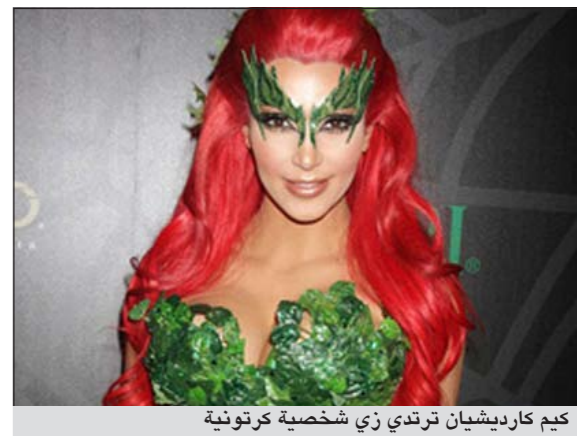
كيم كارديشيان بزي شخصية كرونيتي

دبي - إم.بي.سي: احتفلت نجمات هوليوود بعيد الهالوين أو عيد القديسين، عبر أزياء وتقاليع غريبة، فقد حرصت نجمة برامج الواقع الأميركية كيم كارديشيان على ارتداء الزي الأخضر المميز لشخصية «اللاب السام» أحد اعداء «باتمان» في الحفل الذي حضرته بمدينة نيويورك. أما نجمة التلفزيون الأميركية هايدي كلوم، فقد صبغت جسدها باللون الأحمر المميز لعضلات الجسد وكانها جثة خضعت للتشريح، حسب صحيفة «الدبلي ميل»، وقالت كلوم عن الزي: إنه مثل جثة تم خلع الطبقة الخارجية من جلدها.