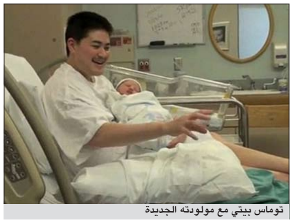
توماس بيتي مع مولودته الجديدة

دبي - إم.بي.سي.نت: بعدما أثار ضجة إعلامية ودينية، قال أول رجل ينجب أطفالاً في العالم: إنه يفكر في استئصال رحمه بعدما أنجب 3 أولاد مع زوجته. وأعلن توماس بيتي - خلال برنامج تلفزيوني - أنه اكتفى من خوض تجربة الإنجاب لما لها من آثار على جسمه أتعبهته خلال مرحلتي الحمل والولادة.