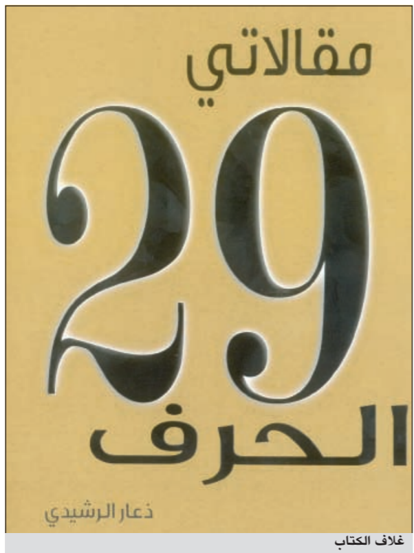
الزميل ذعار الرشيد