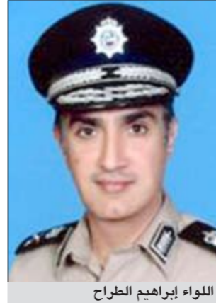
اللواء إبراهيم الطراح

رابعة الدفع يابانية الصنع مع مركبة أميركية تقودها مواطنة في منطقة الصليبية، وفور تلقي بلاغ الاصطدام توجه رجال الأمن إلى موقع البلاغ لمعاينة حادثة الاصطدام الا ان رجال الأمن ولدى وصولهم إلى موقع البلاغ اكتشفت لهم المفاجأة تلو الأخرى، إذ تبين اولاً ان قائد السيارة اليابانية هرب من موقع الحادث بعد ان أوقف آسيويًا يقود مركبة أميركية هو الآخر وأشهر السلاح الناري في وجهه وسلب مركبته، وبلاستعمال عن المركبة التي كان يقودها اللص تبين ان هذه المركبة