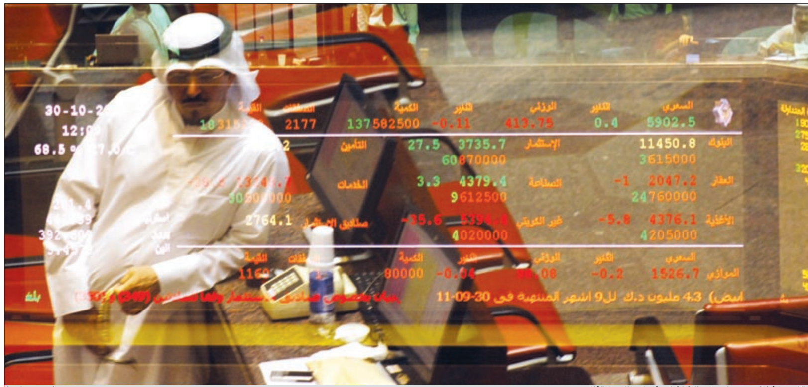
اللون الأخضر سيجر على الشاشات في لحظات الإقبال

استهل سوق الكويت للأوراق المالية تعاملات الأسبوع الأخير قبل عطلة عيد الأضحى على ارتفاع عزز به استقرار المؤشر العام للسوق فوق مستوى 5900 نقطة، وجاء هذا الارتفاع في الثواني الأخيرة التي شهدت تحول مسار مؤشر السوق من انخفاض إلى ارتفاع جراء تقلب مؤشر قطاع البنوك الذي كان متراجعا لأكثر من 100 نقطة. وشهدت الجلسة تباينا في الأداء على مدار فترات التداول، حيث بدأ السوق تعاملاته على ارتفاع محدود على مستوى مؤشره جراء عمليات تجميع لعدد من الأسهم خاصة الأقل سعريا مثل الصفقة وجلوبل والامتياز وإيفا ودانة، ولكن مع مرور الوقت تراجع أداء السوق جراء عمليات بيع شملت أسهما رخيصة وأخرى ذات قيم سعرية مرتفعة وخاصة في قطاع البنوك الذي كان أكثر القطاعات ضغطا على المؤشرات، وكانت عمليات البيع تهدف جني الأرباح وهو الأمر الذي قابلته عمليات دخول على بعض الأسهم المغربية للمشراء مما أدى إلى تذبذب مؤشرات السوق أغلب فترات التداول قبل حسم الأمر في الثواني الأخيرة. ويعود مفتعل لأهداف مضاربة ارتفع خاصة وأنه لم يتفاعل مع التحسن الكبير الذي شهدته أسواق المال العالمية على وقع تواصل قادة منطقة اليورو لاتفاق يهدف إلى انقاذ العملة الأوروبية والحد من تفاقم أزمة الديون الأوروبية. ومن المتوقع أن يواصل السوق أداءه المضاربي خلال تداولات الأسبوع الجاري مع احتمال الجنوح للخارج بهدف التسييل الذي عادة ما يسبق