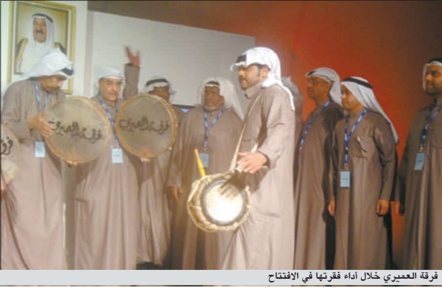
فرقة العميري خلال أداء فقرتها في الافتتاح