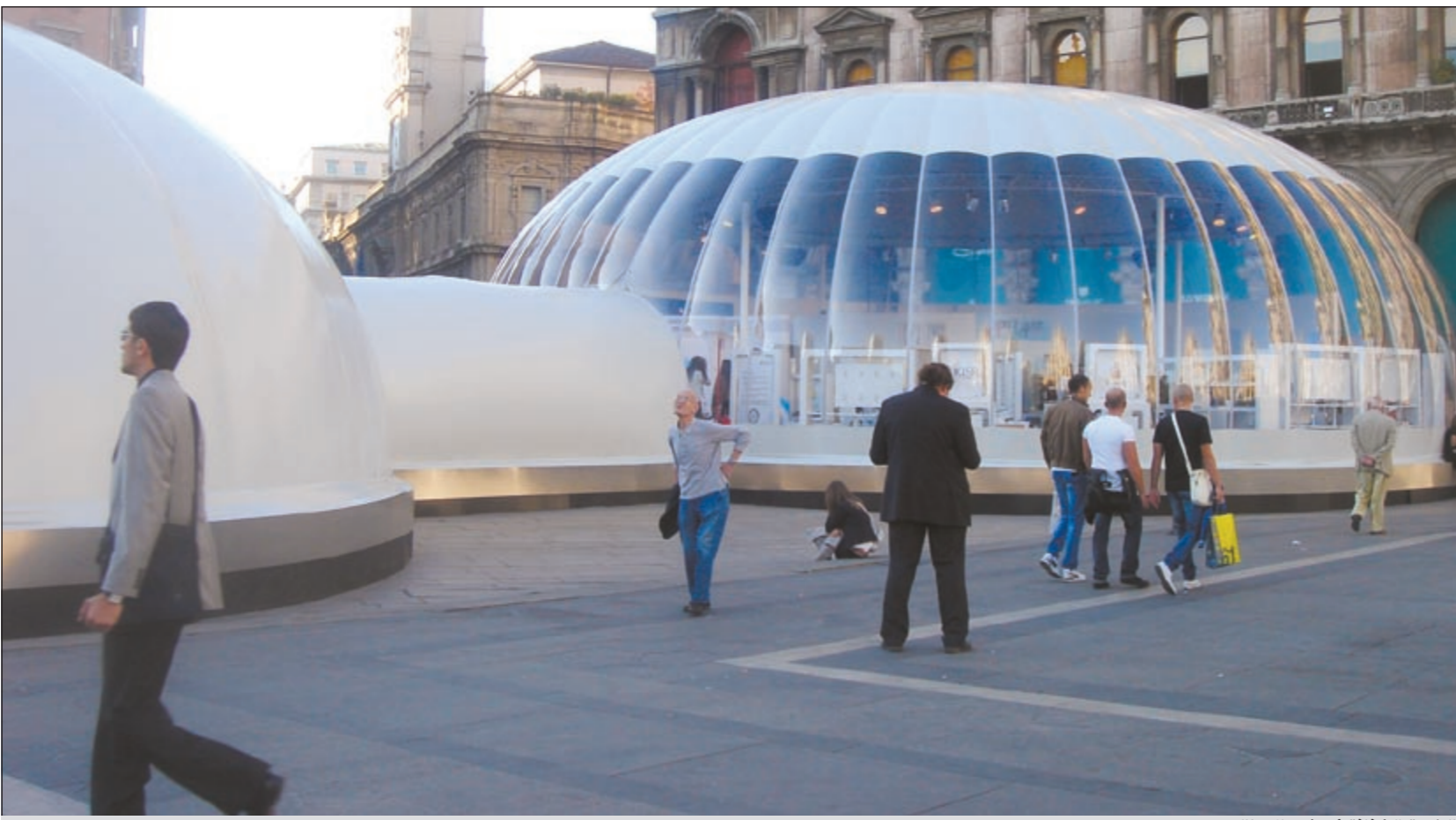
الخيمة الشفافة أدهشت الإيطاليين