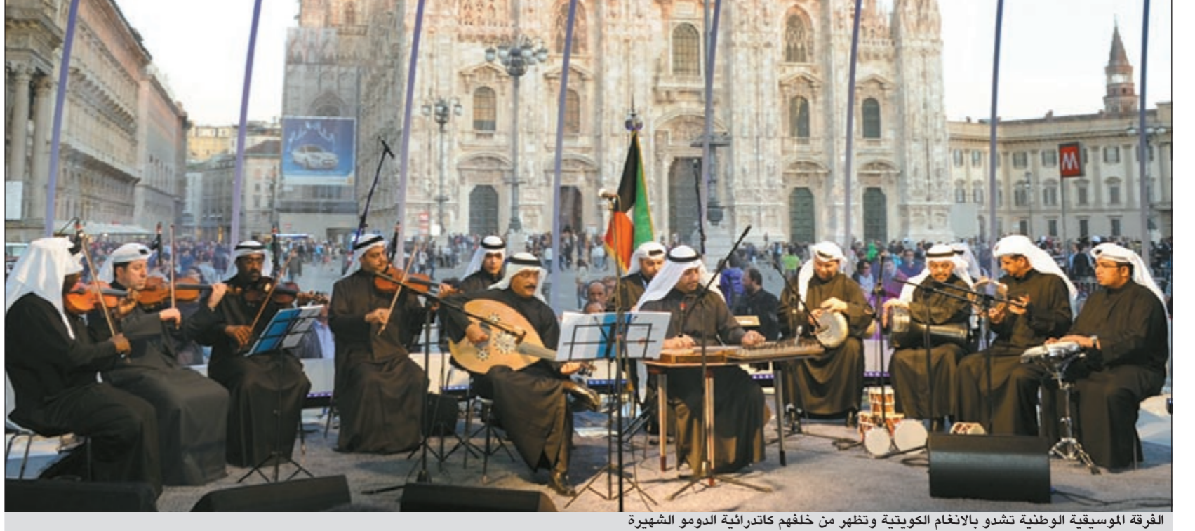
الفرقة الموسيقية الوطنية تشدو بالانغام الكويتية وتظهر من خلفهم كاتدرائية الدومو الشهيرة