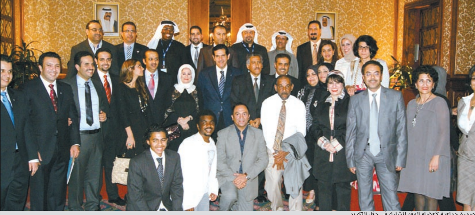
صورة جماعية لأعضاء الوفد المشارك في حفل التكريم