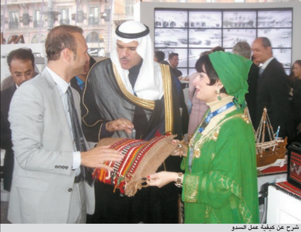
شرح عن كيفية عمل السدو