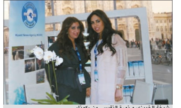
شبكة الخبزي و ثورة النفيسي من «كونا»

وقد شاركت كل من وزارة الإعلام - المجلس الوطني للثقافة والفنون والآداب - الهيئة العامة للصناعة - شركة نفط الكويت الإيطالية - الهيئة العامة للبيئة - وزارة الصحة - الصندوق الكويتي للتنمية الاقتصادية العربية - المجلس الوطني للثقافة والفنون والآداب - النادي العلمي - معهد