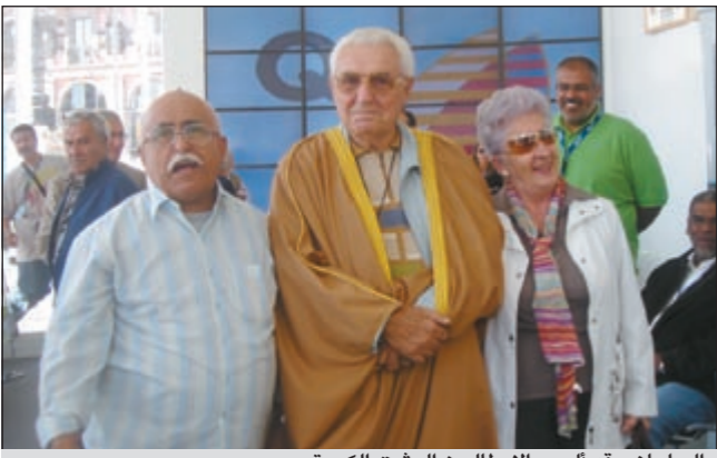
السلطان وقد ألبس الإيطاليين البشت الكويتي