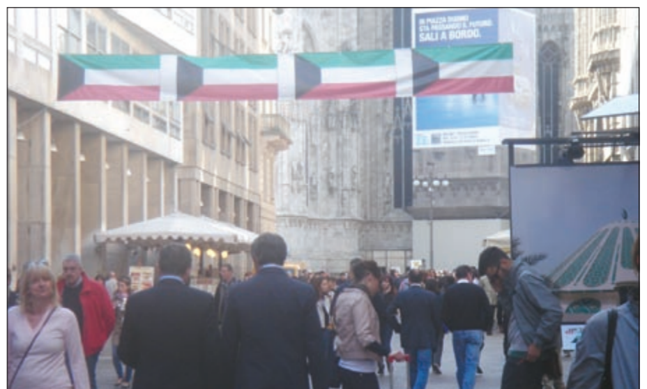
اعلام الكويت تزين شوارع ميلانو