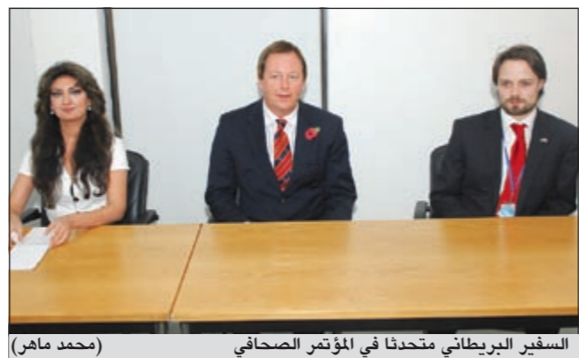
السفير البريطاني متحدثاً في المؤتمر الصحفي (محمد ماهر)