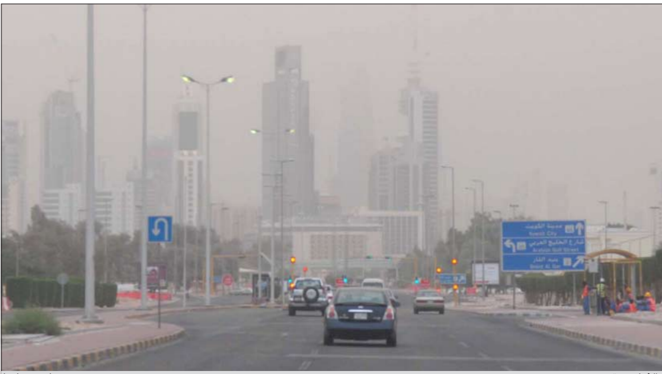
الغبار يستمر يومين