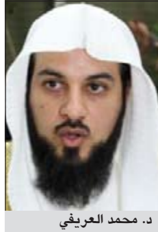
د. محمد العريفي

ووفقاً لما نقلته صحيفة «اليوم» السعودية قال العريفي: إن «ساهر» تعمد مخالفة أكثر من سيارة بمحاذاة سيارة أخرى على الطريق نفسه بمسافات متقاربة، بحيث لا يفصل بين السيارة والأخرى أكثر من 100 متر، مؤكداً عدم اباحة ما يفعله ساهر «شراً او عرفاً».