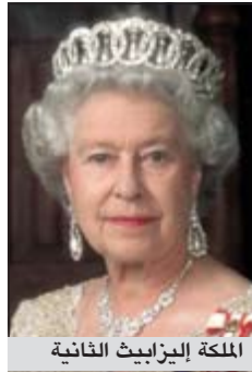
الملكة إليزابيث الثانية

رؤساء حكومات دول الكومنولث التي أقرت تعديل قانون وراثة العرش الملكي بحيث بات بإمكان الابنة البكر أن تتبوأ العرش وليس أخوها حتى وإن كان أصغر منها.