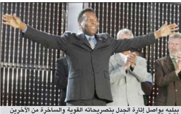
بيليه يواصل إثارة الجدل بتصريحاته القوية والساخرة من الآخرين

اعتبر المهاجم البرازيلي الأسطوري بيليه أنه أعظم لاعب في تاريخ كرة القدم، صنف حديث مع شبكة «اي اس بي ان» الأميركية. وأصر بيليه (71 عاما) أنه لم يشاهد من هو أفضل منه منذ اللحظة التي اعتزل فيها اللعبة، وذلك في خضم الأصوات التي تعتبر راهنا ان الأرجنتيني ليونيل ميسي مهاجم برشلونة الإسباني هو الأفضل. وقال «الجوهرة» الذي أحرز كأس العالم 3 مرات مع «سيلساو»: «اعتقد ان قدوم بيليه آخر هو أمر صعب لأن والدتي والدي اقلنا الماكينة... هناك لاعبون ممتازون، قد يخوض احدهم مباريات أكثر مني أو يسجل أهدافا أكثر من رصيدي، لكني اعتقد ان هذا صعب». وعلى رغم وصفه لميسي بأنه أفضل لاعب في العالم حاليا، الا ان بيليه اعتبر المهاجم البرازيلي الصاعد نيمار الذي يحمل الوان سانتوس ثانيه السابق، سيصبح الأفضل في العالم