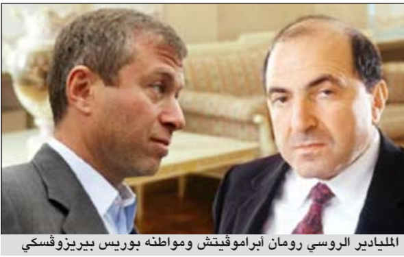
الملياردير الروسي رومان أبراموفيتش ومواطنه بورييس بيريزوفسكي

بريدج، حسم أرسنال «دربي» العاصمة لندن بفوزه على تشلسي (3-5)، في مباراة مثيرة ومجنونة شهدت تالاق نجم أرسنال روبن فان بيرسي الذي سجل «هاتريك» ليقتود «المدفعجية» لانتصار كبير على «البلوز» على ملعبه ووسط جماهيره. وفي الشوط الأول تقدم تشلسي بهدف فرانك لامبارد (14) قبل أن يتعادل فان بيرسي لارسنال (36) ثم تقدم تشلسي عبر جون تيري (45)، وفي الشوط الثاني نجح أرسنال في تحويل تأخره 2-1