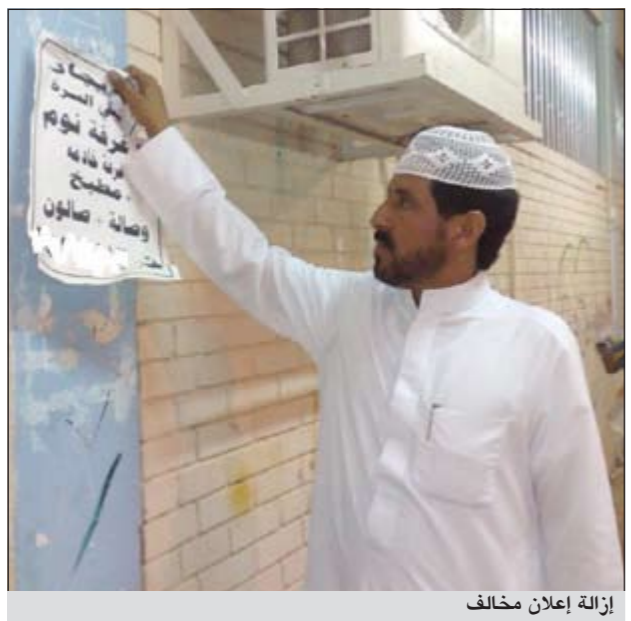
إزالة إعلان مخالف