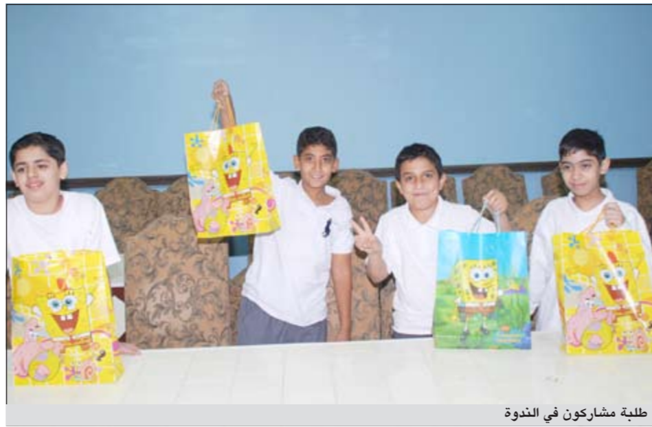
طلبة مشاركون في الندوة

بين البلدية ووزارة الصحة للرقابة على المقاصف المدرسية وتوجيه الرعاية الشاملة