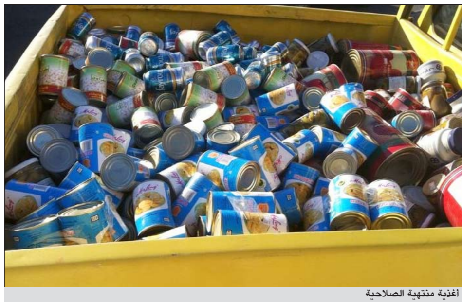
أغذية منتهية الصلاحية