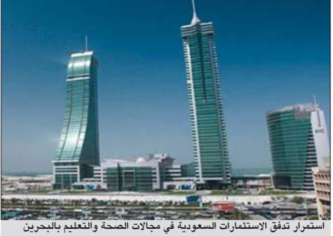
استمرار تدفق الاستثمارات السعودية في مجالات الصحة والتعليم والبحرين

باريس - د.ب.أ: هدد العاملون بشركة «اير فرانس» للطيران بتنظيم إضراب من المتوقع أن يشل حركة الإقلاع التي ينتظرها العديد من الفرنسيين للاحتفال ببطلة قصيرة في يوم القديسين الذي يوافق الأول من نوفمبر المقبل. وجاء في بيان للشركة أول من أمس ان اليوم سيشهد الغاء رحلة من بين كل خمس رحلات من رحلاتها، مضيفا انه من المتوقع ايضا تأخير بعض الرحلات عن موعدها. وترجع الاضرابات إلى احتجاج العاملين على خطط التقشف التي اتخذتها ادارة الشركة. وتعزم الشركة التقليل من عمل المراقبين الجويين على بعض خطوطها، الأمر الذي تعدد النقابات تهديدا للامن على من الطائرات. ومن المقرر ان يستمر الإضراب حتى يوم الأربعاء المقبل.