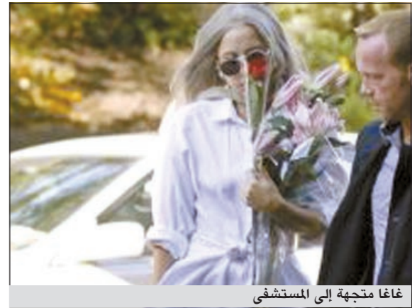
غاغا متجهة إلى المستشفى

وكالات: شوهدت المغنية الأميركية ليدي غاغا تتوجه إلى مستشفى مانهاتن لفترة طويلة، وكانت ترتدي فستانا طويلا من اللون الأبيض، وكانت تحمل في يدها باقة من الورد، وبعد خروجها من المستشفى أكدت غاغا انها كانت تزور صديقا مقربا مريضا بالرغم من انها «مشغولة» طوال الوقت، إلا ان زيارة صديقها ضرورية، بل هي «بنفس أهمية العمل».