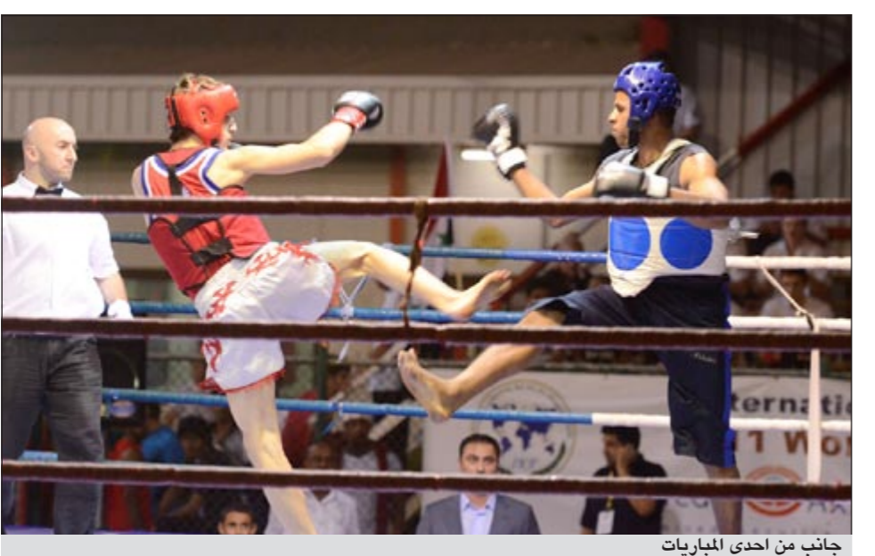
جانب من إحدى المباريات

ونأمل أن تقترح الكويت كلها مرة أخرى حيث لم تقترح جماهيرنا فرحة كبيرة بتحقيق لقب خارجي منذ التتويج الأخير للأزرق في خليجي 20 باليمن، ومن الممكن أن يكون الكويت خير سفير ويعوض الخروج المحزن للعربي والقاسية في دوري أبطال الخليج بالدور نصف النهائي.