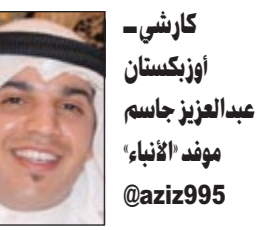
كارشي - أوزبكستان

في اللعب هجوما ودفاعا وتشكيلته الأساسية في تدريبات اليوم على الملعب الرئيسي للمباراة بعيدا عن أعين ناساف وكاميراتهم.