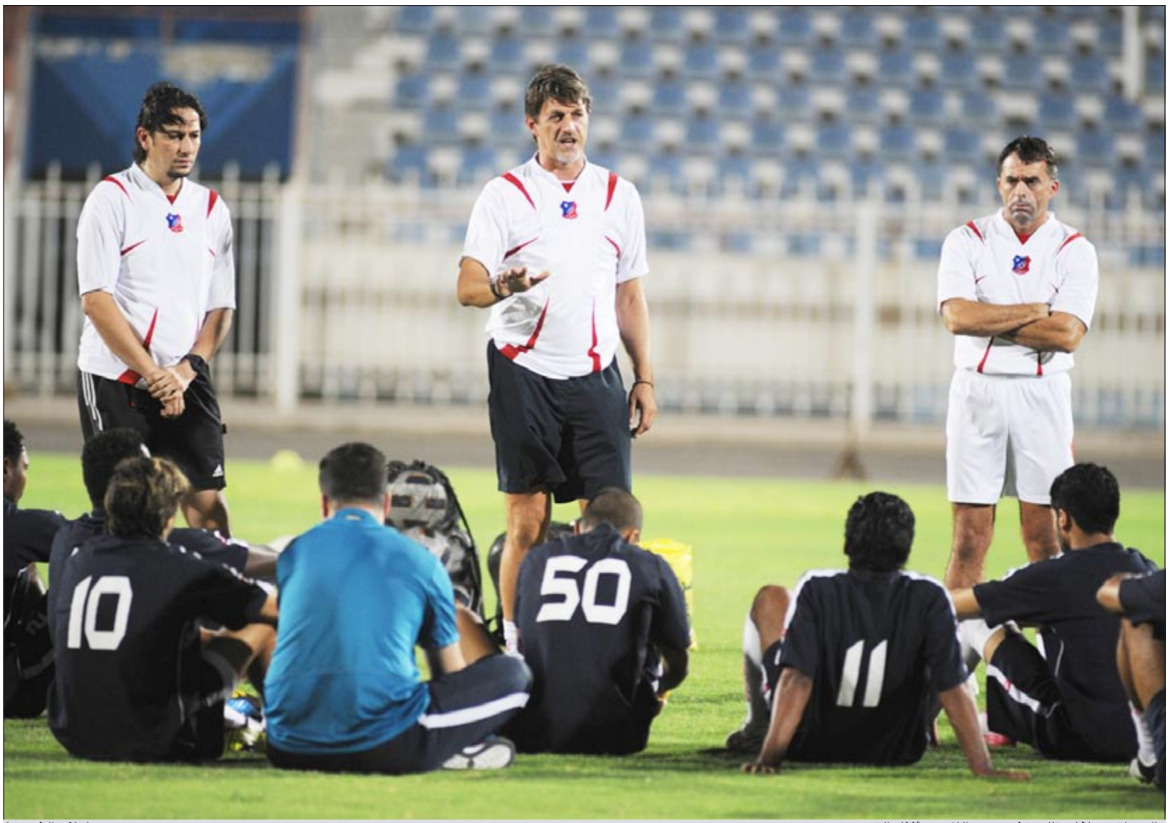
الكرواتي دراغان تالاييتش يوجه اللاعبين أثناء التدريب

على لاعبي الأبيض الذين جاءوا إلى أوزبكستان من أجل حصد اللقب ولاشيء غيره على الرغم من صعوبة المباراة لعدة عوامل أهمها أن المنافس قوي ويلعب كرة منظمة ثم ناتسي لعالمي الأرض والجمهور وهما يصبان في مصلحةهم بلاشك إلا أن رجال الكويت عودنا دائما على تخطي الصعاب.