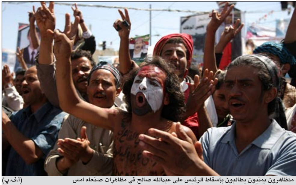
متظاهرون يمنيون يطالبون بإسقاط الرئيس علي عبدالله صالح في مظاهرات صنعاء امس (أ.ف.ب)

وأضاف: ان هذا العمل تم تصويره في اجواء صعبة، لكن الصعوبة الحقيقية كانت في اختيار الشخصيات التي تظهر بالفيلم، والتي اخترتها بناء على معيار واحد هو الخوف، فظهر بالفيلم مواطنون كسروا حاجز الخوف، وقرروا الثورة على الاستبداد ولم تخفهم اسئلة دماء اصدقائهم واخوانهم، الذين اختاروا الشهادة في سبيل تحرير وطنهم من نظام «بن علي» القمعي، كما ظهرت بالفيلم شخصيات سياسية كانت تمارس سياسة تخويل المواطن التونسي لسنوات طويلة لكي يبقى خانعا لهم، لكن التواؤسة لم يخفوا وثاروا على من حاولوا تخويلهم حتى اسقطوا نظامهم المستبد.