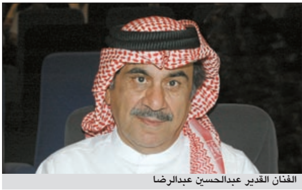
الفنان القدير عبدالحسين عبدالرضا