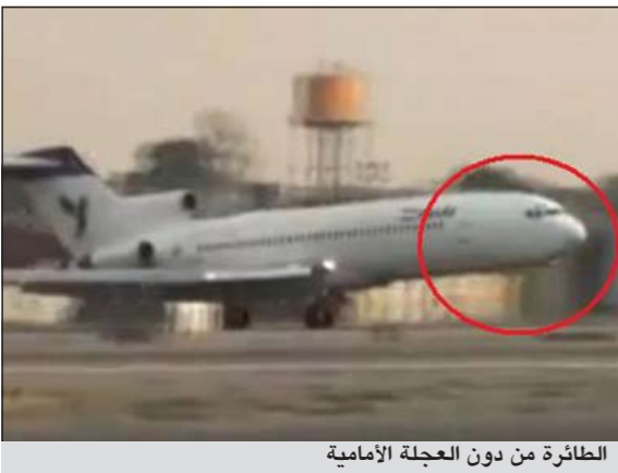
الطائرة من دون العجلة الأمامية

طهران - وكالات: أفادت «الخطوط الجوية» الإيرانية في بيان بأن طائرة تابعة لها آتية من موسكو قامت بهبوط اضطراري في طهران اثر خلل في عجلات الهبوط، ولم يصب أي من ركابها الـ 116 بأذى وأورد الموقع الإلكتروني للتلفزيون الإيراني الرسمي نقلاً عن بيان للشركة ان طائرة من طراز بوينغ 727 تابعة للخطوط الجوية الإيرانية هبطت من دون مشاكل رغم خلل في عجلات الهبوط التابعة لها، وكانت الطائرة تقل 97 راكبا و19 شخصاً هم أفراد طاقمها وحوادث الطيران مألوفة في إيران بسبب تقادم اسطولها الجوي المدني والعسكري وانعدام الصيانة جراء حصار غربي على طائراتها وقطع غيارها فرضته واشنطن في الثمانينيات اثر الثورة الإسلامية. وشهدت إيران 15 حادثاً جواً في السنوات العشر الاخيرة أسفرت عن أكثر من 900 قتيل.