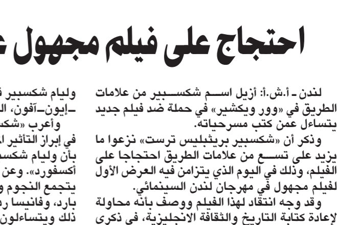
أنجلينا على غلاف المجلة

بولندية ان النجمة الهوليوودية أنجلينا جولي قامت السبت بزيارة مفاجئة لمعسكر أوشفيتز السابق للاعتقال الذي بناه النازيون أثناء احتلالهم بولندا أثناء الحرب العالمية الثانية. وقالت ان جولي تزور سرا معسكر أوشفيتز السابق للاعتقال الذي بناه النازيون أثناء احتلالهم بولندا أثناء الحرب العالمية الثانية. وقالت ان جولي تزور سرا معسكر أوشفيتز السابق للاعتقال الذي بناه النازيون أثناء احتلالهم بولندا أثناء الحرب العالمية الثانية.