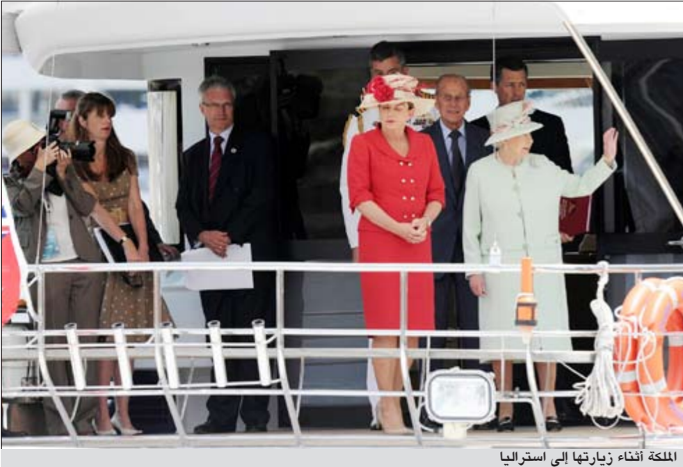
الملكة أثناء زيارتها إلى أستراليا

من جهة أخرى، اعتقلت الشرطة الأسترالية ناشطاً مناهضاً للنخبوية كشف عن مؤخرته أمام ملكة بريطانيا خلال زيارتها إلى مدينة بريزبان.