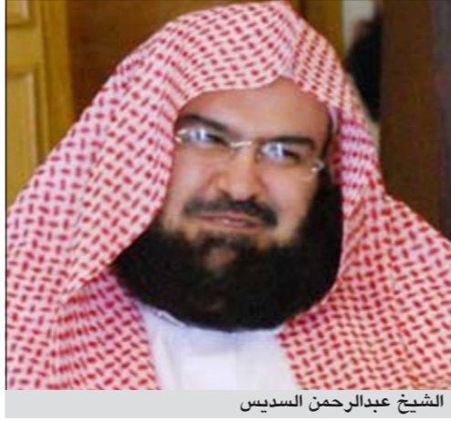
الشيخ عبدالرحمن السديس

الرياض: أوضح أحد المقربين من فضيلة الشيخ عبدالرحمن السديس أمام المسجد الحرام أن فضيلته حي يرزق ويتمتع بالصحة والعافية. وأفسد المصدر المقرب من إمام الحرم المكي في اتصال هاتفي مع «الوثام» بأن ما تردد مساء أمس عن وفاة الشيخ عبدالرحمن السديس لا صحة له وأنه جاء بسبب لبس بسبب خبر نشر في صفحة الوفيات بإحدى الصحف المحلية وإن فضيلته بصحة وعافية.