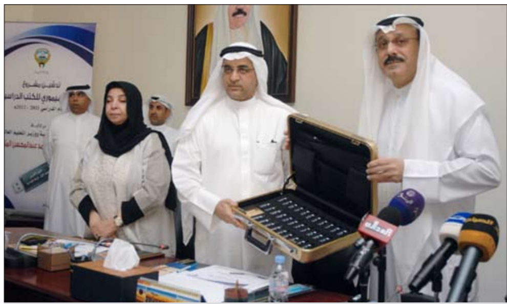
وزير التربية ووزير التعليم العالي أحمد المليفي يتسلم حقيبة الفلاش ميموري من م. معرفي وتبدو السديراوي (سعود سالم)

دشن وزير التربية ووزير التعليم العالي أحمد المليفي مشروع الكتاب الإلكتروني (الفلاش ميموري) بتكلفة مخفضة بلغت 259 ألف دينار، بدلا من 420 ألف دينار وخلال 4 أشهر فقط من بدء الدفع بتنفيذ المشروع الذي مر بالخطوات الإجرائية في ديوان المحاسبة ولجنة المناقصات المركزية وبدأت الوزارة التفكير في تنفيذه من العام 2004/2005.