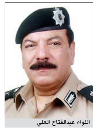
اللواء عبدالفتاح العلي

هذا وأمر اللواء العلي بمصادرة المضبوطات وإحالة الموقوفين كلا على حسب تهمته حيث أحيل المخالفون إلى إدارة الإبعاد، أما بالنسبة للعاملين في أوكار الاتصالات فأحيلوا