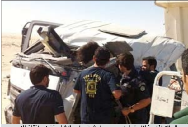
رجال الإطفاء خلال تعاملهم مع حادث تصادم الشاحنتين وانقاذ الأسوي

الشاحنات بسبب التسابق في انزال الحمولة في مشروع منطقة جابر الأحمد، وانحسر أحدهما بالكابينة مما استلزم تقطيع الشاحنة بمعدات هيدروليكية وإخراج المصاب من جنسية أسبوية بأقل أضرار وتسليمه للطوارئ الطبية.