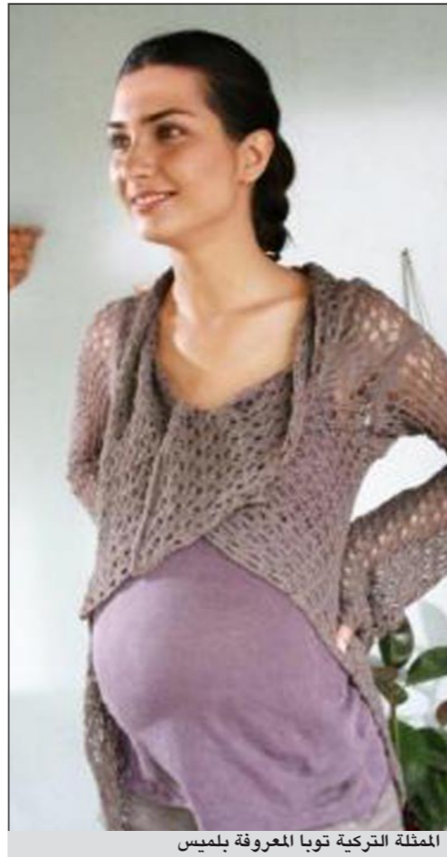
الممثلة التركية توبا المعروفة بللميس

انقرة - وكالات: الممثلة التركية توبا المعروفة بللميس وفي اطلالتها الأولى بعد الحمل في لقاء مع مجلة سيدتي قالت انه بعد مرور 4 شهور على الحمل تفضل ان تلقي السلام على الناس من بعيد خاصة ان الوقت الحالي خصب جدا لنقل عدوى الإنفلونزا وأكدت انها تسعى من خلال رفضها السلام باليد او بالقبلة لحماية التوأم.