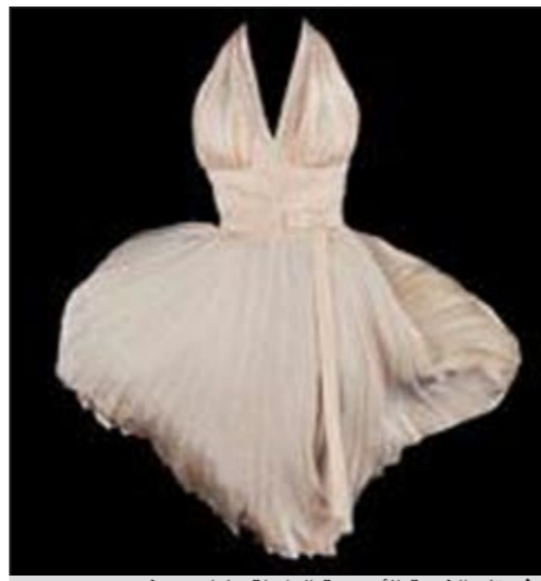
فستان النجمة الأميركية الراحلة مارلين مونرو

لندن - يوبي.آي: بيع فستان مخملي أخضر ارتدته النجمة الأميركية الراحلة مارلين مونرو في أحد أفلامها في مزاد علني أقيم في الصين بسعر فاق النصف مليون دولار. وأفادت صحيفة «ديلي ميل» البريطانية بأن الفستان الذي ارتدته مونرو في فيلم «نهر اللاعوبة» التلفزيوني بيع إلى شاسار لم يكشف عن اسمه مقابل 504 آلاف دولار. وقال رئيس دار «جوليان» للمزادات دارين جوليان إن الفستان بيع في مزاد بالصلن، مشيراً إلى أن مونرو لبسته عندما ردت أغنية في الفيلم الذي عرض بالعام 1954 وتجسد فيه شخصية زوجة مقامر تدعى كاي واشنطن. يشار إلى أن مارلين مونرو واسمها الحقيقي نورما جين بيكر تعد أسطورة في عالم السينما الأميركية وقد توفيت منتحرة عن عمر 36 سنة إثر تناولها جرعة زائدة من الدواء.