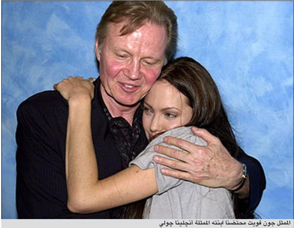
الممثل جون فويت محتضنا ابنته الممثلة أنجلينا جولي

(37 عاما) بسبب علاقته النسائية التي أقامها من وراء ظهر والدتها. وكان للممثل براد بيت رفيق جولي دور كبير في المصالحة التي تمت بين فويت وجولي في فينسيا العام الماضي. وقال فويت «فجأة أصبحت أرى الأشياء بصورة مختلفة وتغير كل شيء.. هذه اللحظة غيرت حياتي بأكملها». وأضاف «لقد أعادت لي ابنتي وأسرتي.. فالتصالح مع انجي كان أمرا غالبا بالنسبة لي». وأعرب فويت عن حبه الشديد لأحفاده ووصفهم بحبه الكبير. وقال «عندما تراني ابنتي معهم تقول أنها ترى في طاقة أخرى تملكنتي».