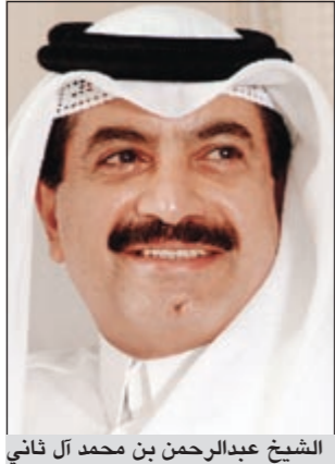
الشيخ عبدالرحمن بن محمد آل ثاني