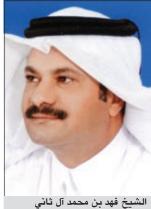
الشيخ فهد بن محمد آل ثاني

تفوقه الكبير بسبب احتوائه على أكبر عدد من الفرص والجوائز لأكثر عدد من الفائزين. ومن ضمن «محفظة القروض المكتسبة» قدم بنك الدوحة أفضل عرض لقروض السيارات بدون أي فائدة أي بأقل معدلات الفائدة في دولة قطر. ومن أبرز التطورات الأخيرة التي تدعو إلى الفخر والاعتزاز هي حصول بنك الدوحة على جائزة «أفضل بنك في دولة قطر لعام 2011» من قبل مجلة أريبيان بيزنس، وجائزة «أفضل بنك تجاري في دولة قطر» من قبل مجلة ورلد فاينانس، وجائزة «أفضل بنك في مجال التمويل التجاري في دولة قطر لعام 2011» من مجلة جلوبال فاينانس.