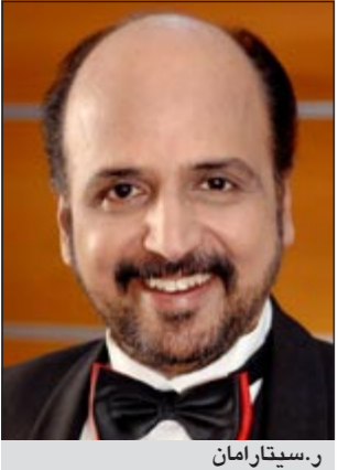
ر. س. عتيقارمان