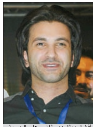
أفضل ممثل دور ثان - علي الحسيني