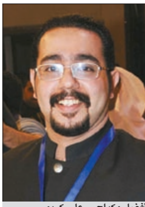
أفضل مكياج - علي كريم