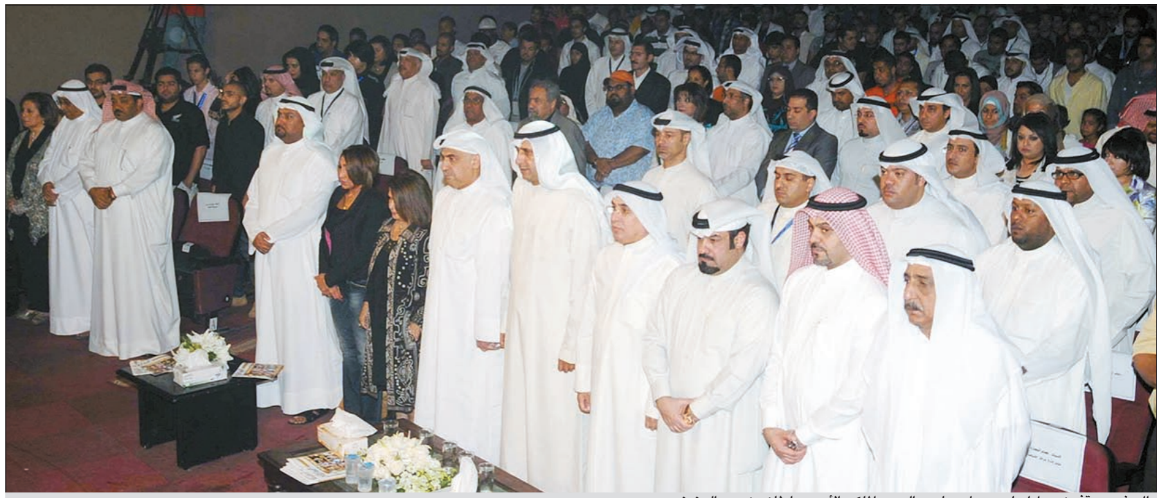
الحضور يقفون حدادا على رحيل صاحب السمو الملكي الأمير سلطان بن عبد العزيز

في الحفل الختامي للدورة الثامنة بحضور الجراف ويعقوب