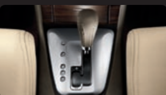
ناقل حركة بنفذية التغير المستمر CVT مع وضعية النقل اليدوي بـ 6 سرعات