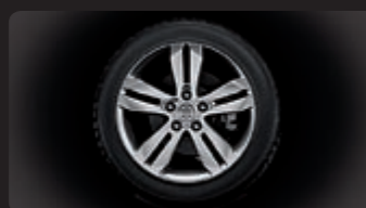
عجلات من الألمنيوم قياس 16 إنش