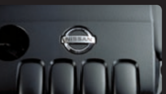
محرك سعة 2.5 لتر بقوة 188 حصان