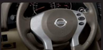
مفاتيح مبنية على العودة للتحكم الأبي بالسرعة