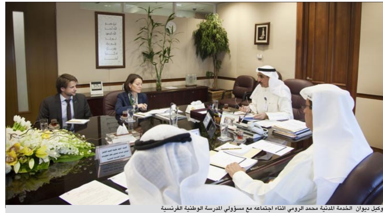
وكيل ديوان الخدمة المدنية محمد الرومي أثناء اجتماعه مع مسؤولي المدرسة الوطنية الفرنسية

وزير التربية يطلب من صفر توسعة المدرسة الوطنية الأهلية خاطب وزير التربية ووزير التعليم العالي أحمد المليفي وزير الأشغال العامة ووزير الدولة لشؤون البلدية د.فاضل صفر حول طلب توسعة القسيمة الكائنة بمنطقة حولي - قطعة 33 خلف مجمع الرحاب الخاصة بمدرسة الوطنية الأهلية. جاء في خطاب المليفي: في إطار تنفيذ توجهات الدولة ورؤيتها الاستراتيجية نحو الاهتمام بالقطاع الخاص وتسهيل مهمته في المشاركة في العملية التعليمية. وحيث أن المدرسة الوطنية الكائنة بمنطقة حولي - قطعة رقم 33 تعد من المدارس المتميزة تربوياً وتعليمياً وتحتاج إلى التشجيع في تادية رسالتها التربوية وذلك من خلال الموافقة على طلب توسعة مساحة القسيمة التي تشغلها المدرسة إلى 2م8000 لاستيعاب الطلب المتزايد على الخدمات التعليمية التي تقدمها. بجراء الموافقة لإعادة عرض الموضوع على المجلس البلدي علماً بأن إدارة التنظيم بالبلدية ليس لديها مانع من التوسعة المطلوبة.