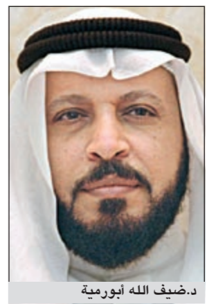
د.ضيف الله أبورية

حذر النائب د.ضيف الله أبورية وزير الدفاع الشيخ جابر المبارك من المعاطلة في الرد على الأسئلة التي وجهها له بخصوص شبكات تنفيج وتجاوز على المال العام من خلال مناقصات تمت بطريقة غير قانونية وبشكل مخيف للشعبية. وقال أبورية: لقد وجهت عدة أسئلة للنائب الاول وزير الدفاع بخصوص شبكات وتجاوزات تمت من خلال عقد عدة مناقصات إضافة الى تعاقدات مباشرة لشراء سيارات مدنية وتحويلها الى عسكرية،