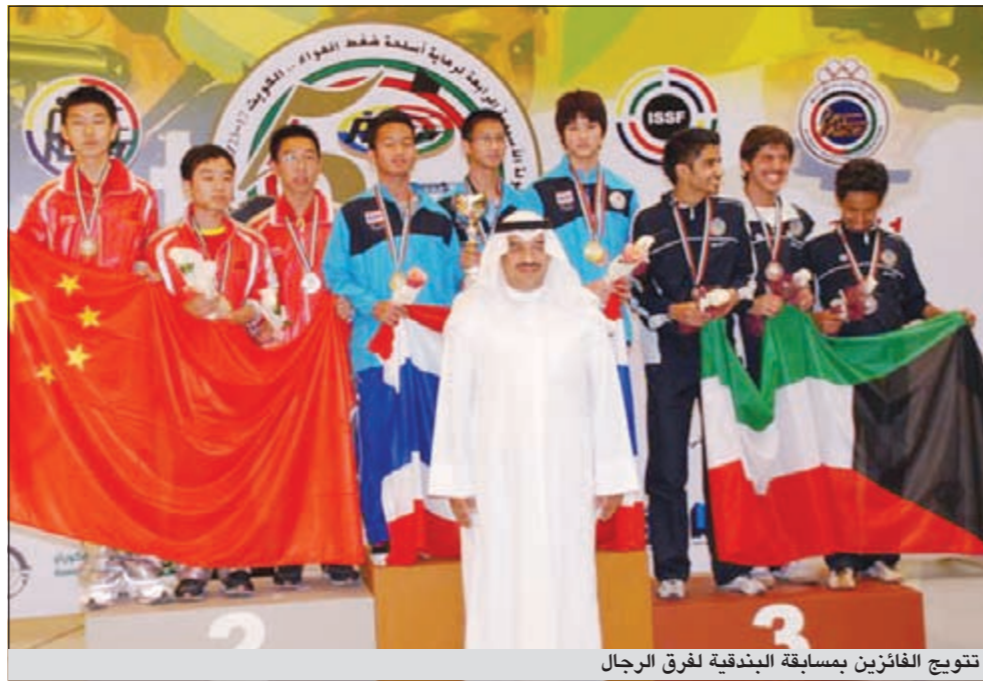
تتويج الفائزين بمسابقة البندقية لفرق الرجال