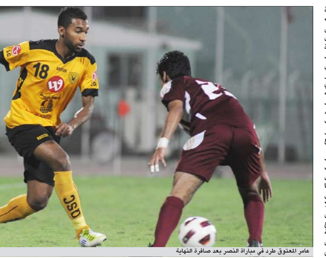
عالم المعنوق طرد في مباراة النصر بعد صافرة النهاية (هاني الشمري)