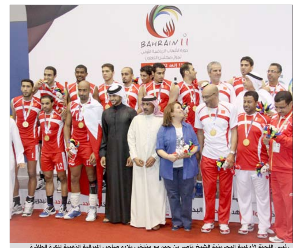
رئيس اللجنة الأولمبية البحرينية الشيخ ناصر بن حمد مع منتخب بلاده صاحب الميدالية الذهبية لكرة الطائرة