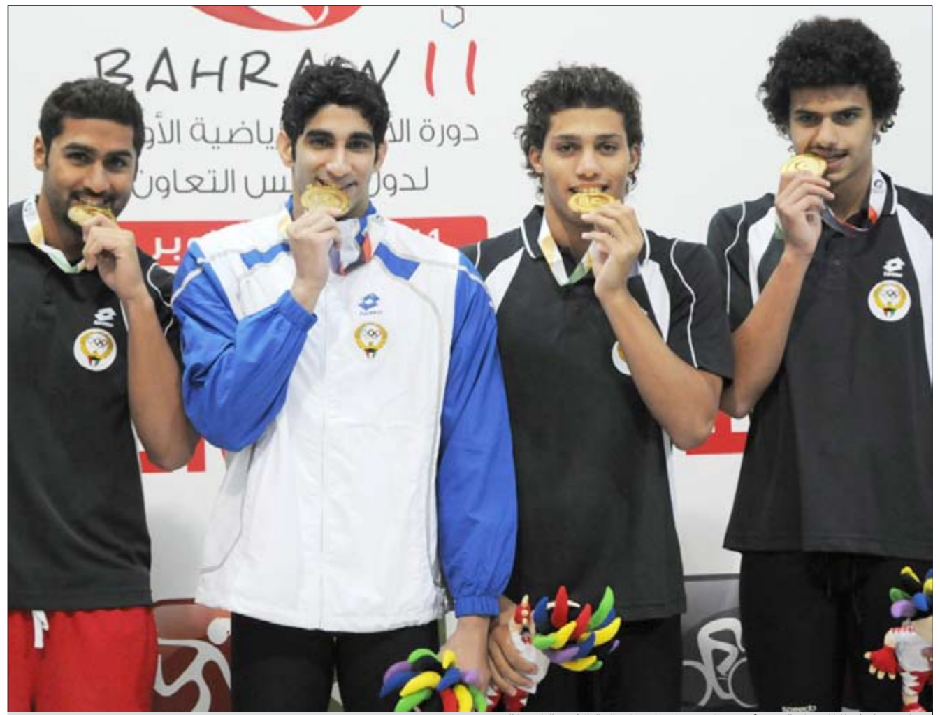
رباعي منتخبنا للسباحة يحتفلون بالحصول على الميدالية الذهبية لسباق 100 متر حرة