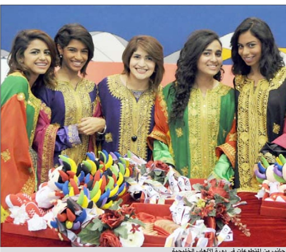
جانب من المتطوعات في دورة الألعاب الخليجية