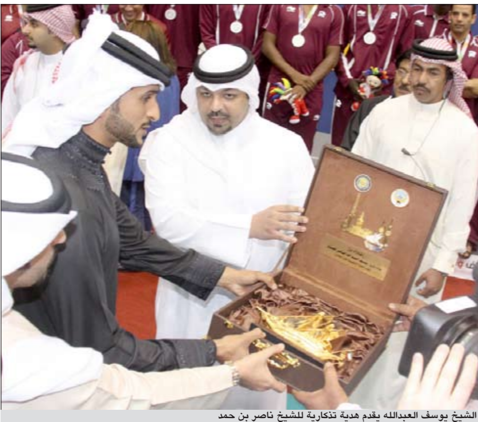
الشيخ يوسف عبدالله يقدم هدية تذكارية للشيخ ناصر بن حمد

48 ميدالية ملونة لأبطالنا قبل اليوم الأخير منها ذهبية السعودية تحرز لقب كرة الهدف للمكفوفين بفوزها على الإمارات