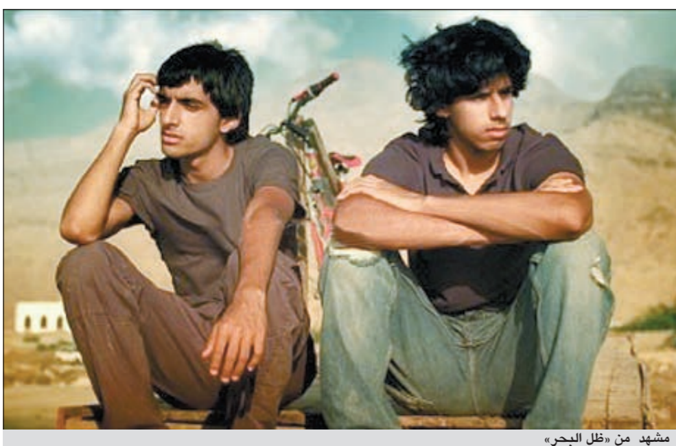
مشهد من «ظل البحر»