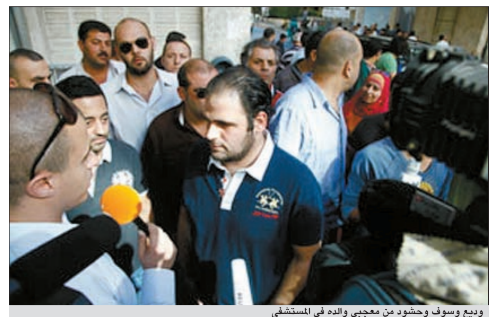
وديع وسوف وحشود من معجبي والده في المستشفى

«عفوا يا حبايب» الذي تقدمه على إذاعة «جرس سكوب» ان حالة وسوف مستقرة وفي تحسن مستمر وان الطبيب طمانهم على صحته. وقال: «وسوف لديه مشكلة في يده ورجله اليسرى بسبب الجلطة التي أصابت رأسه، وعلينا الانتظار 24 ساعة إضافية للتأكد من زوال الخطر عنه وهو لا يحتاج إلى عملية جراحية بل إلى علاج فيزيائي دائم»، من جانب آخر، قامت الفنانة نجوى كرم بالاتصال بزوجة الفنان جورج وسوف للاطمئنان على صحته بعد الأزمة الصحية التي تعرض لها، كما حضرت إلى المستشفى الفنانة مي حريزي، فيما يتواجد في المستشفى فريق من المسؤولين من شركة «روتانا» ويتوقع أن يصدروا بياناً عن حالة وسوف الصحية، كما نقل الإعلامي شادي خليفة عبر «الجديد».