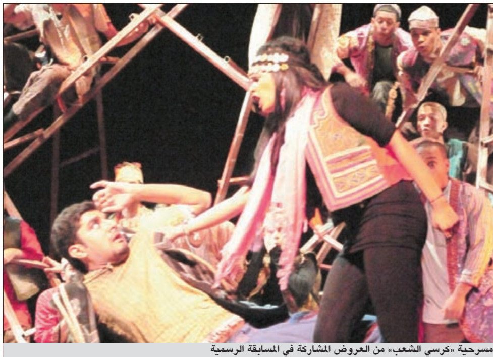
مسرحية «كرسي الشعب» من العروض المشاركة في المسابقة الرسمية