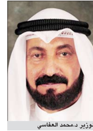
الوزير د.محمد العفاسي