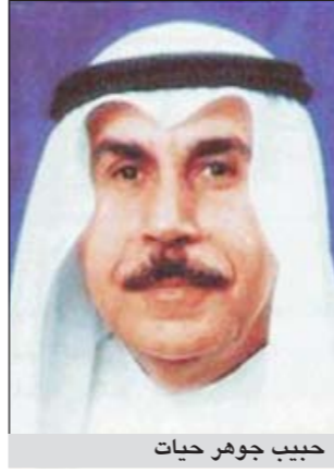
حبيب جوهر حيات