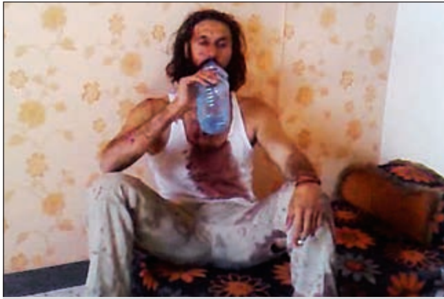
... ونجده المعتصم يجلس في هدوء يشرب الماء والسيجارة قبل قتله