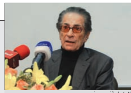
الراحل أنيس منصور

رحيل «أنيس منصور» رجل الفلسفة وأديب الرحلات بعد رحلة طويلة من العطاء والتميز في عالم الثقافة والأدب والصحافة