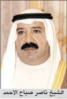
الشيخ ناصر صباح الأحمد