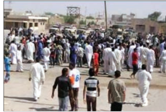
مجموعة من المتظاهرين العراقيين بالقرب من منفذ صفوان