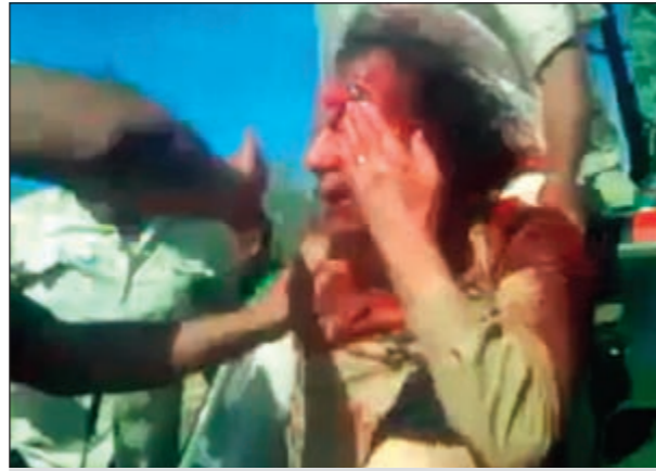
العقيد الليبي معمر القذافي يتعرض للضرب على أيدي الثوار إثر اعتقاله (روبنز)