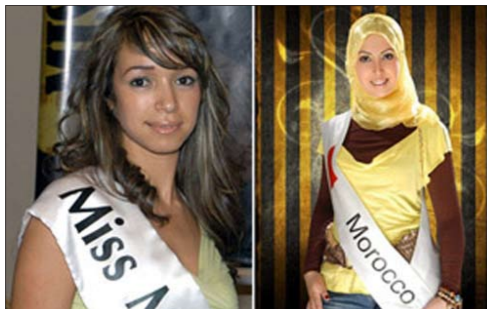
مشاركين في المسابقة

وعزيمتها، في تطوير مغربها الحديث والمتجدد. وأضاف أنه سيتم اختبار المتوجة وفق معايير تركز على الجانب المعرفي والثقافي والرياضي والجمالي، مع الحفاظ على التناسق الحداثي المعاصر مع الأصالة المغربية العتيقة، وقال إن المسابقة تختلف عن معايير المسابقات الدولية المتعارف عليها، تماشيا مع مقومات التقاليد والعادات المغربية والقيم الإسلامية، بحيث سيتم التخلي عن كل ما يمس حميمية المشاركات كالباسهين مثلا لباس السباحة.