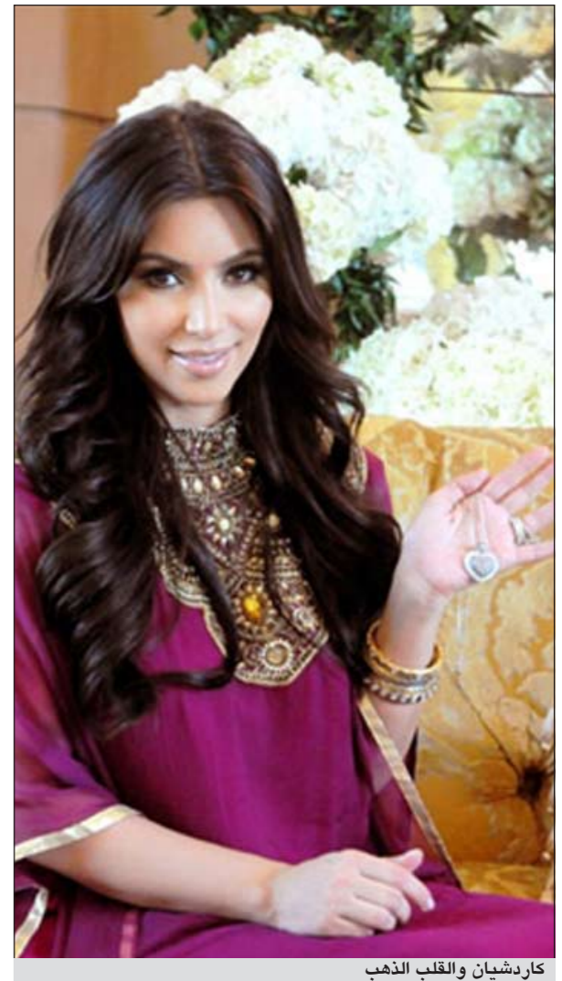
كارديشان والقلب الذهب

وقد قدمت «معوض» لنجمة هوليوود كيم كارديشان، التي زارت الإمارات خلال نهاية الأسبوع الماضي، عقدا من «روزيت كولكشن» على شكل قلب وذلك ترحيبا بها واحتفاء بوجودها في الإمارات كونها واحدة من الزبونات المخلصات للدار في لوس أنجليس. وتتوافر العقادة التي تلقتها كيم في معرض أبوظبي الدولي للمجوهرات والساعات وكافة متاجر «معوض»، ويبلغ ثمنها 25 ألف دولار.