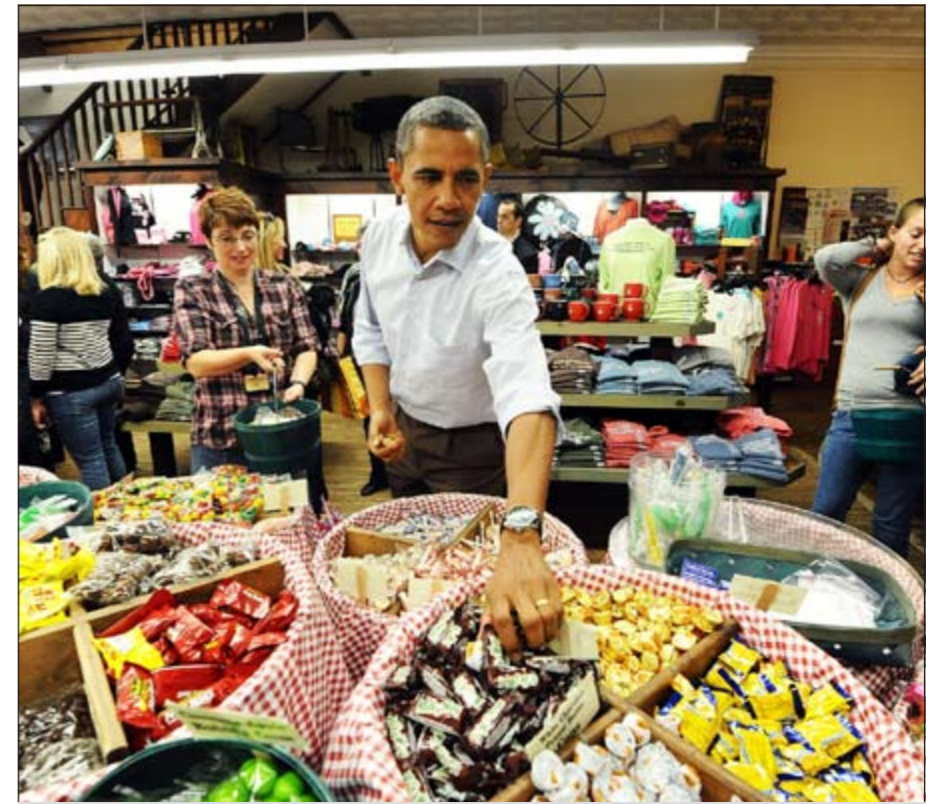
أوباما يشتري يقطينيات

هامبتون - أ.ف.ب: اشترى الرئيس الأمريكي باراك أوباما وزوجته ميشيل الأربعة حوالي عشر يقطينيات من بائع في فيرجينيا (شرق) لترزين البيت الأبيض تحضيرا لاحتفالات «هالوين».