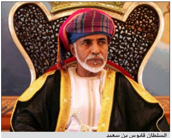
السلطان قابوس بن سعيد

وأوضح كيم أن أسلوب كالذي يستخدمه محتجو وول ستريت حاليا- سبق أن استخدمه محاربون قدامى زحفوا إلى واشنطن في فترة الكساد الكبير في ثلاثينيات القرن الماضي، كما استخدمه محتجو الحقوق المدنية في ستينيات القرن الماضي أيضا. وأضاف أن الولايات المتحدة تتمحور ضد السلطة التي تتمتع بها نخبة اقتصادية صغيرة تقوم بالتحكم في مصير المدن ومصائر الأمم، مما ينعكس سلبا على قطاعات عريضة من الناس العاديين.