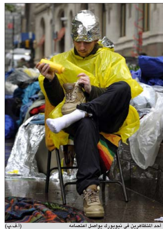
أحد المتظاهرين في نيويورك يواصل اعتصامه

وفريقه قررا تحويل الاحتجاجات والغضب العام في وول ستريت إلى ما أسماه الكاتب خيمة مركزية لإستراتيجية إعادة انتخابهم، أشار إلى أن الحركة أيضا لاقت دعما من جانب الرئيسة السابقة لمجلس النواب الأميركي نانسي بيلوسي وآخرين. لكن الكاتب في المقابل انتقد الأوضاع التي يعيشها محتجو وول ستريت في مخيم «زوكوتي بارك» وسط مانهاتن، بالقرب من موقع مركز التجارة العالمي السابق، وقال إنها أوضاع مزرية تذكر بأوضاع حركة سبيق أن احتلت «توميكينز سكوير» شرقي نيويورك في ثمانينيات القرن الماضي.