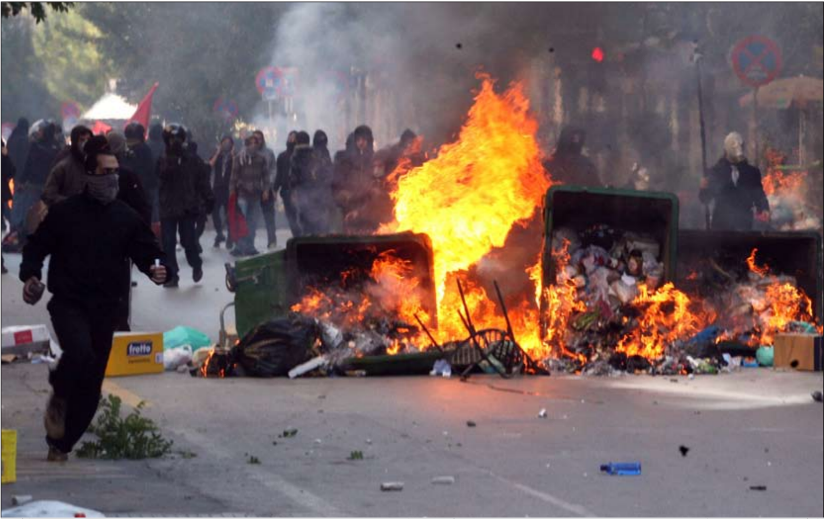
آلاف اليونانيين يتظاهرون في العاصمة اثينا بالقرب من البرلمان احتجاجاً على خطة التقشف الجديدة أمس

وتشمل تلك الإجراءات: الموافقة الفورية على الإفراج عن 8 مليارات يورو من القروض في إطار خطة المساعدات التي يقدمها الاتحاد الأوروبي وصندوق النقد الدولي لليونان والتي اقرت العام الماضي. ● تعزيز صندوق دعم الاستقرار المالي الأوروبي الذي يتضمن حالياً 440 مليار يورو ولكن سيلزم أن يؤمن أكثر من ذلك بكثير إذا طلب منه التدخل لمساعدة إيطاليا أو إسبانيا. ● إعادة رسملة البنوك بما يجعلها أقل عرضة للوقوع في أزمة على غرار الأزمة المالية اليونانية أو التخلف عن دفع المستحقات. ● تحسين التنسيق داخل منطقة اليورو ما قد يشمل الموافقة على خطة فرنسية-ألمانية لعقد قمة مرتين في العام تجمع زعماء بلدان منطقة اليورو وعددها 17 بلداً. ● العمل على النهوض بالنمو الاقتصادي. وقد استخدمت الشرطة اليونانية القنابل المسيلة للدموع لتفريق المظاهرين، وقال شاهد من «رويتزر» إن قوات مكافحة الشغب اليونانية أطلقت غازات مسيلة للدموع على شبان القوا قنابل حارقة عند أطراف مسيرة كبيرة مناهضة لإجراءات التقشف في العاصمة أثينا.