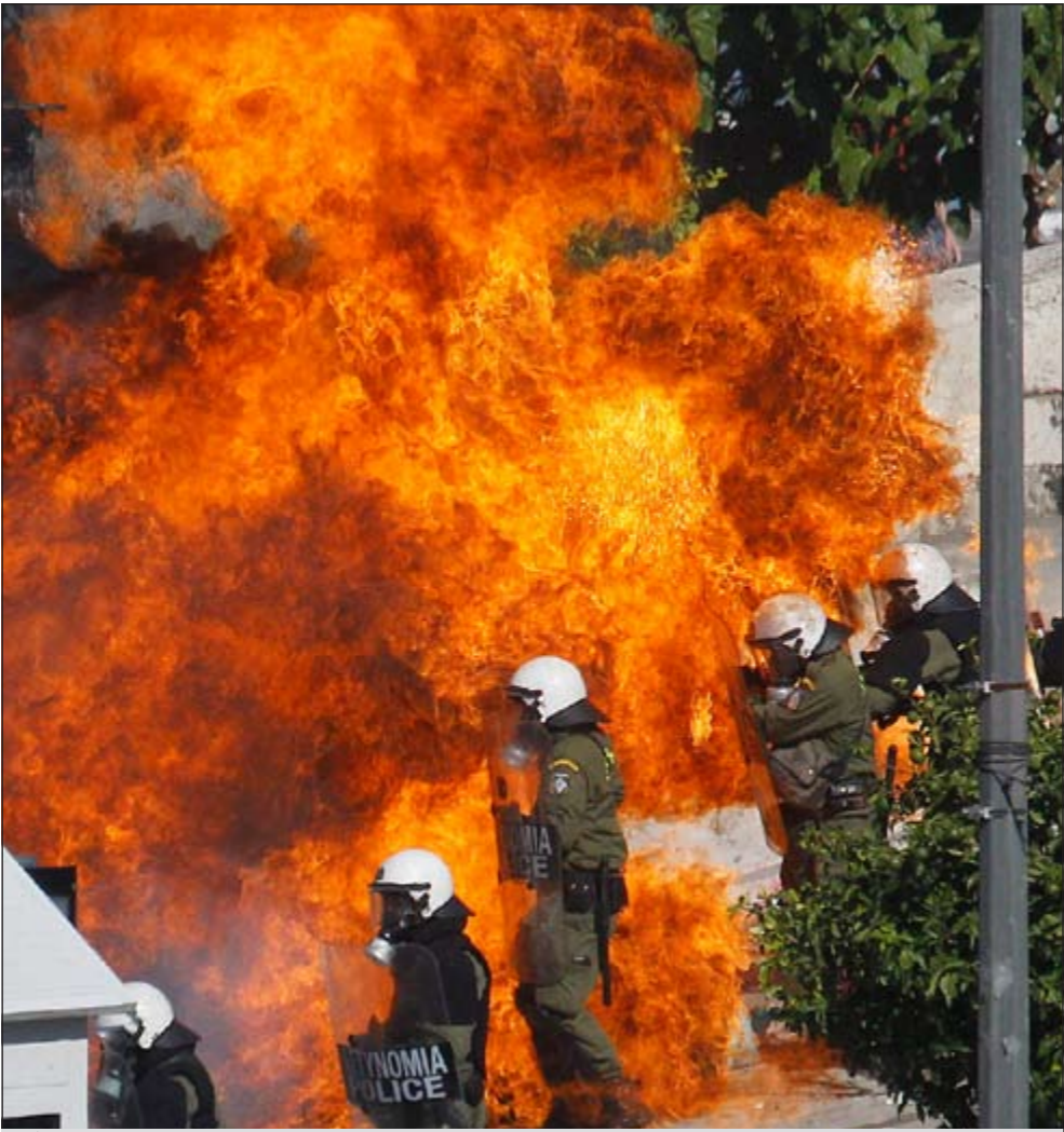
.. والشركة اليونانية تحاول اخماد النيران التي اشعلها المحتجون